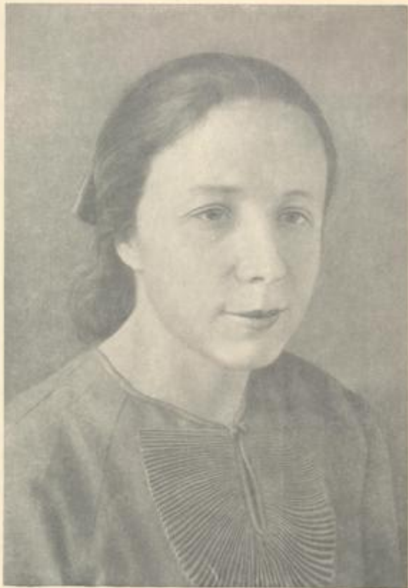
О. И. СКОРОХОДОВА

Я умом Я умом увижу, чу вствами услышу, А мечтой привольной мир я облечу... Каждый ли из зрячих красоту опишет, Улыбнется ль ясно яркому лучу? Не имею слуха Не имею слуха, не имею зренья , Но имею больше — чувств живых простор: Гибким и послушным, жгучим вдохновеньем Я соткала жизни красочн ый узор.