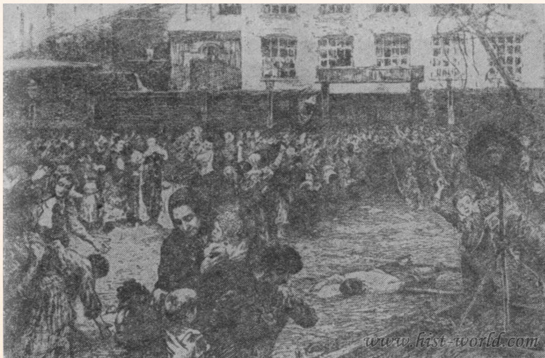
Стачка. С картины художника Н. А. Касаткина.