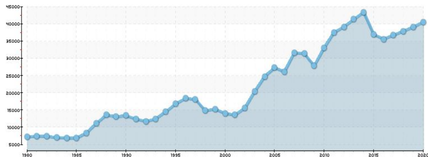
Новая Зеландия - Валовой внутренний продукт на душу населения (долл.)