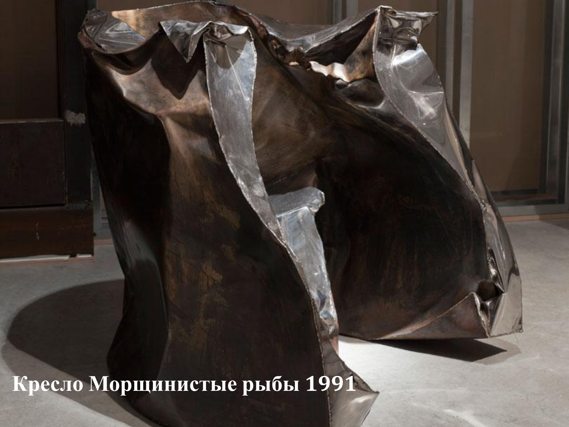
Кресло Морщинистые рыбы 1991