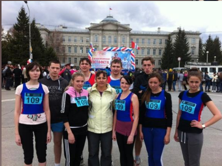
Спартакиада образовательных учреждений высшего профессионального образования Омской области 2013