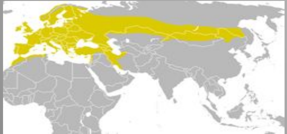
“Большая синица” (Parus major)

Вид этой синицы считается самым распространенным в нашей стране. Особенно часто ее можно встретить в Сибири - от Алтая до Байкала, а также от Архангельска и до Крыма, включая весь Кавказ. Свое название вид синицы получил благодаря довольно крупному размеру (по сравнению с другими синицами). Желтую грудку этой белощекой птички на две равные части разделяет черная полоса, причем более широкая она у самцов. Блестящий черный цвет имеет верхняя часть головы, шея, а также зоб. Часть спины до голубоватого надхвостья имеет нежно-зеленый цвет, а сам хвост и крылья темно-бурого цвета. Большая синица совершенно всеядна: она не прочь полакомиться и кусочком сала или мяса, и семечками, и даже черствым хлебом. >>>