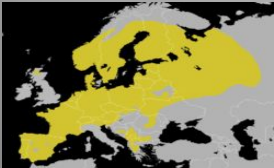
“Гренадёрка” ( Lophophanes cristatus )

Хохлатая синица (вид имеет и такое название) имеет весьма заметное отличие от других синиц, заключающееся в длинном хохолке. Расцветка её оперения довольно тусклая и имеет бурые и рыжие оттенки. Крылья и хвостовая часть темно-бурого цвета, спина - чуть светлее. Бока и брюшко имеют серо-бурый оттенок, грудка - грязно-белого цвета. Хохолок на голове собран из черных перышек с белыми кончиками. От клюва через глаз и от зоба до затылка проходят параллельные черные полосы, а боковые части головы имеют белый цвет.