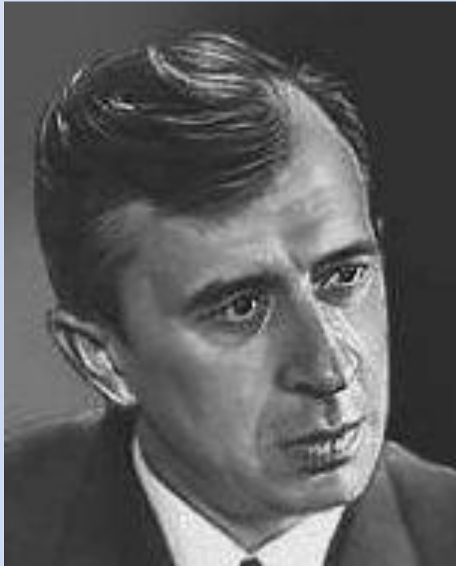
А.В. Жигулин (1930-2000)