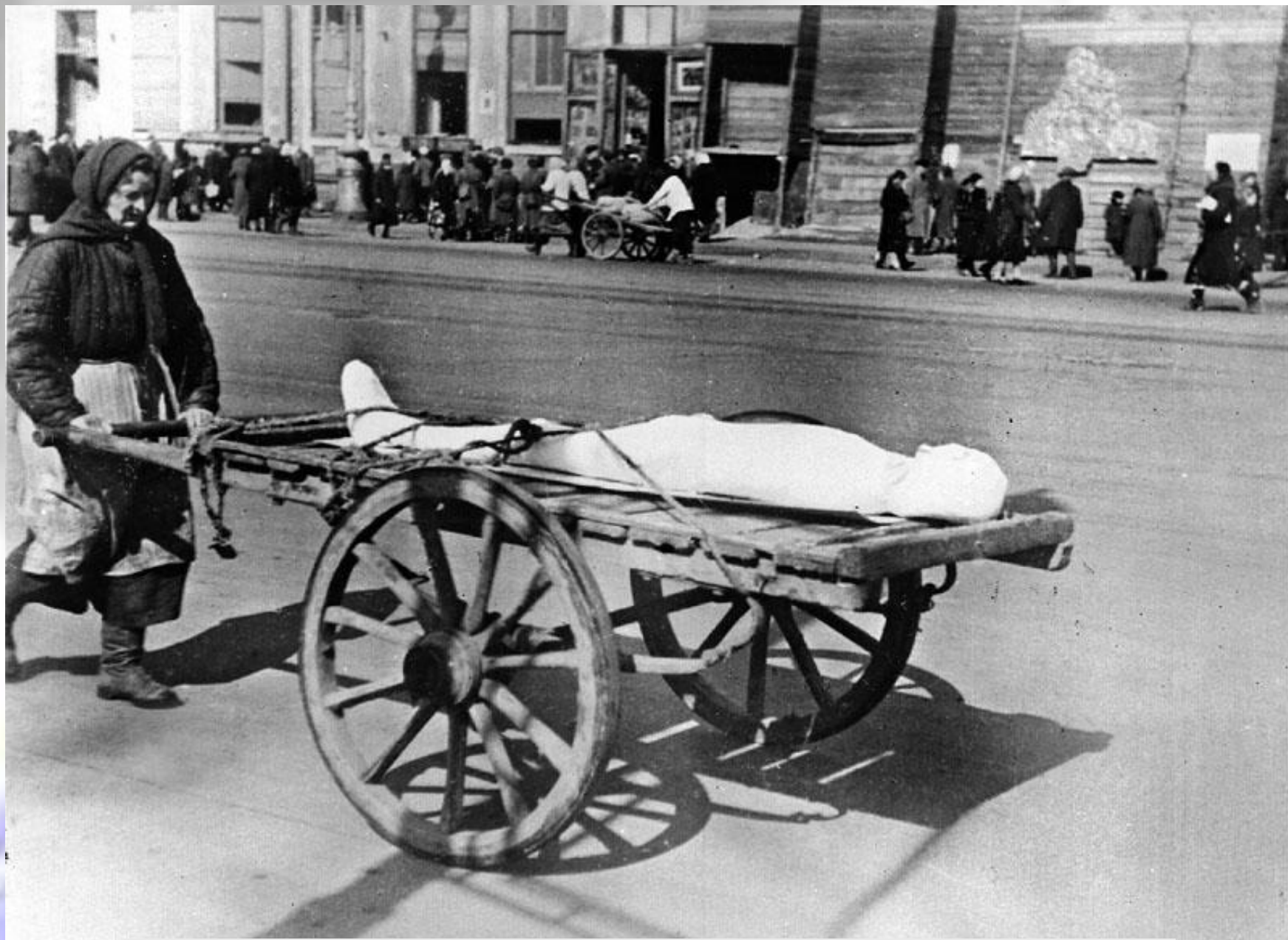
Женщина везет умершего в дни блокады Ленинграда