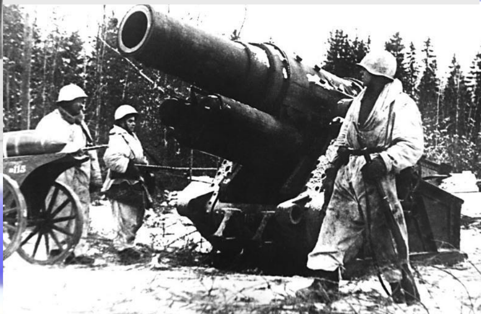
Немецкое тяжелое осадное орудие, обстреливавшее Ленинград