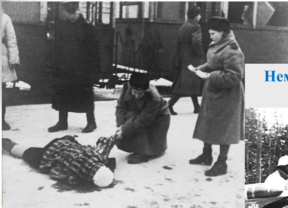
Результаты обстрела. Ленинград, декабрь 1943 г.

После провала немецкого блицкрига В.Лееб был отстранен от командования группой «Север». Его место занял генерал-полковник Г. Кюхлер. Выполняя приказ Гитлера, новый командующий начал вести войну на уничтожение. Немцы обстреливали улицы, сбрасывали бомбы, затапливали продовольственные обозы.