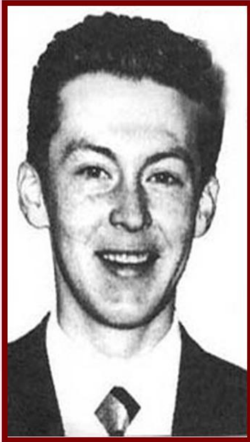
Игитов Юрий Сергеевич 1973 – 1994 Герой России