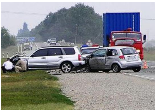
В процессе движения ТС