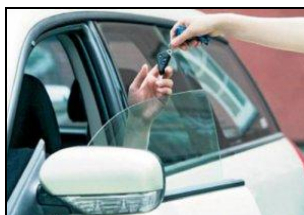
ПРОКАТНЫЕ ТС и ТС, СДАВАЕМЫЕ В АРЕНДУ