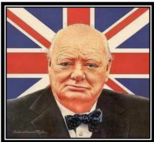
Уинстон Черчилль - премьер-министр Великобритании (1940-1945; 1951-1955)