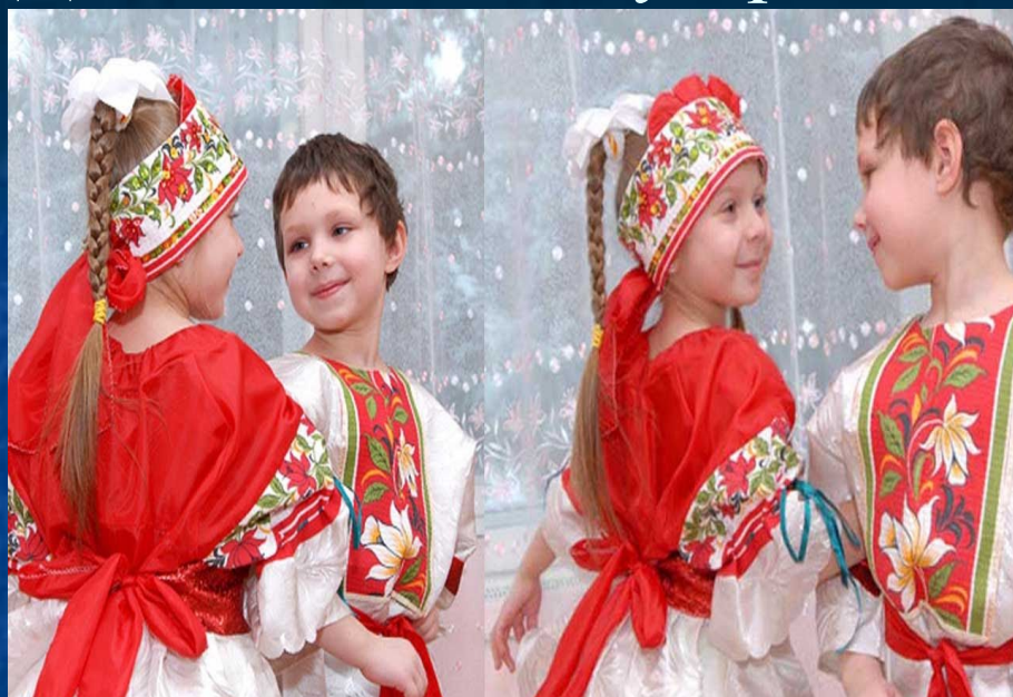
Традиции развивают духовность