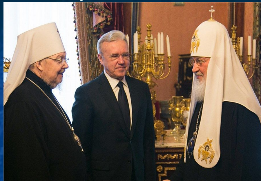
Власть сотрудничает с церковью

Считается, что современные люди все больше теряют духовность и становятся: