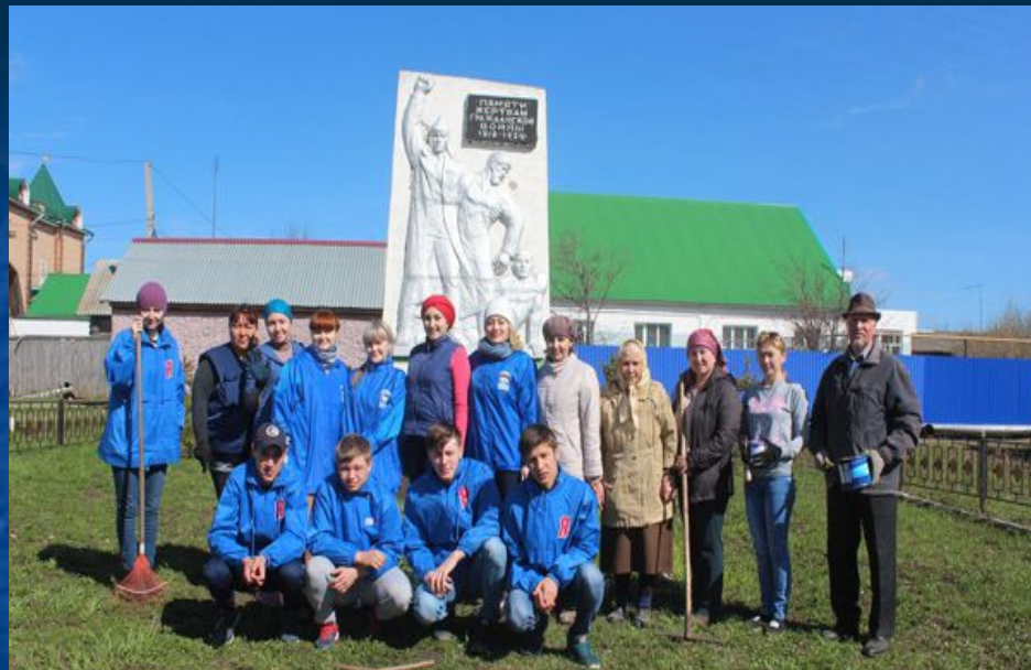
Школьники заботятся о памятниках