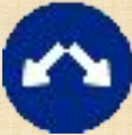
Объезд препятствия справа или слева