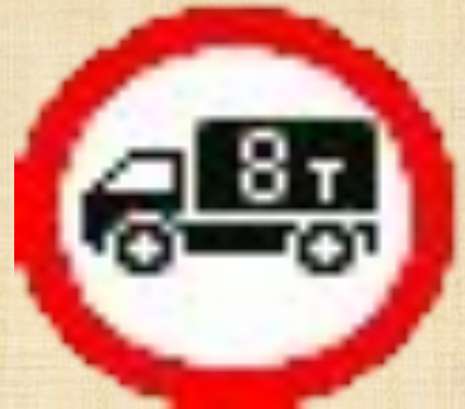
Движение грузовых автомобилей