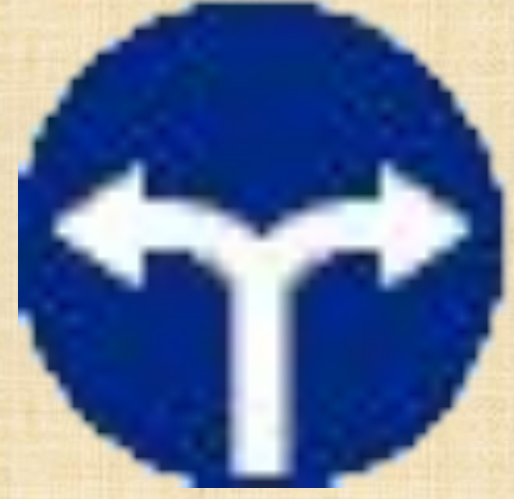
Движение направо или налево