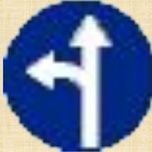
Движение прямо или налево