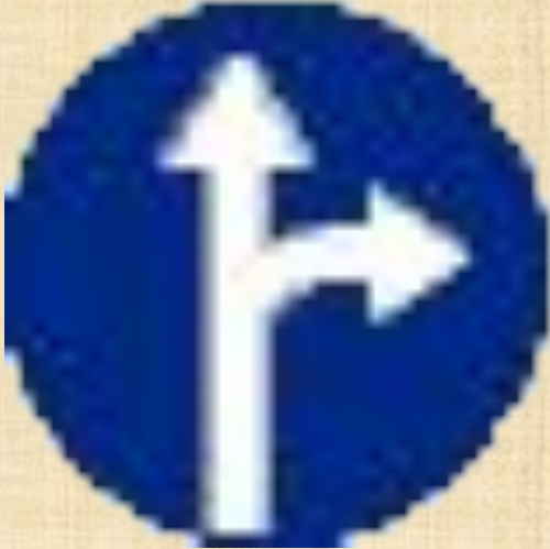
Движение прямо или направо