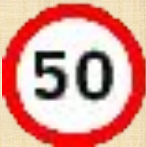
Ограничение максимальной скорости