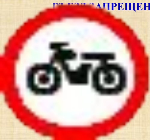
Движение мотоциклов запрещено