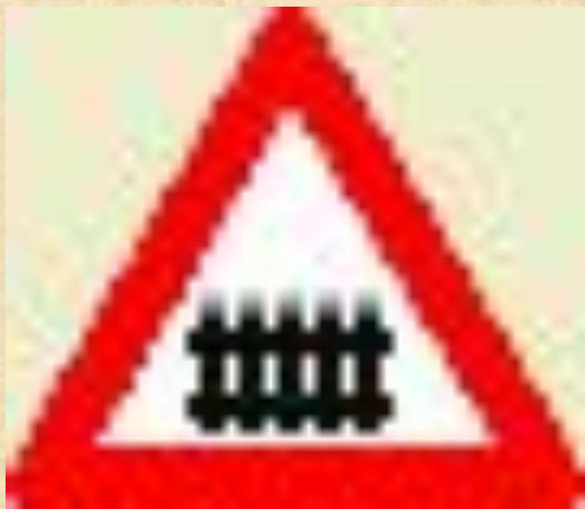
Железнодорожный переезд со шлагбаумом