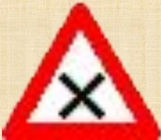
Пересечение равнозначных дорог