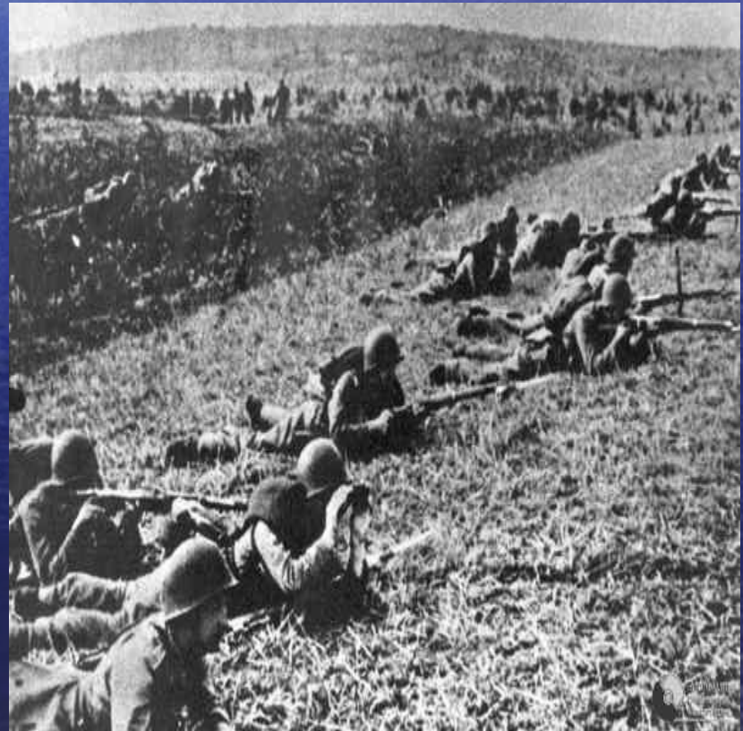
Бои польских солдат 1939г