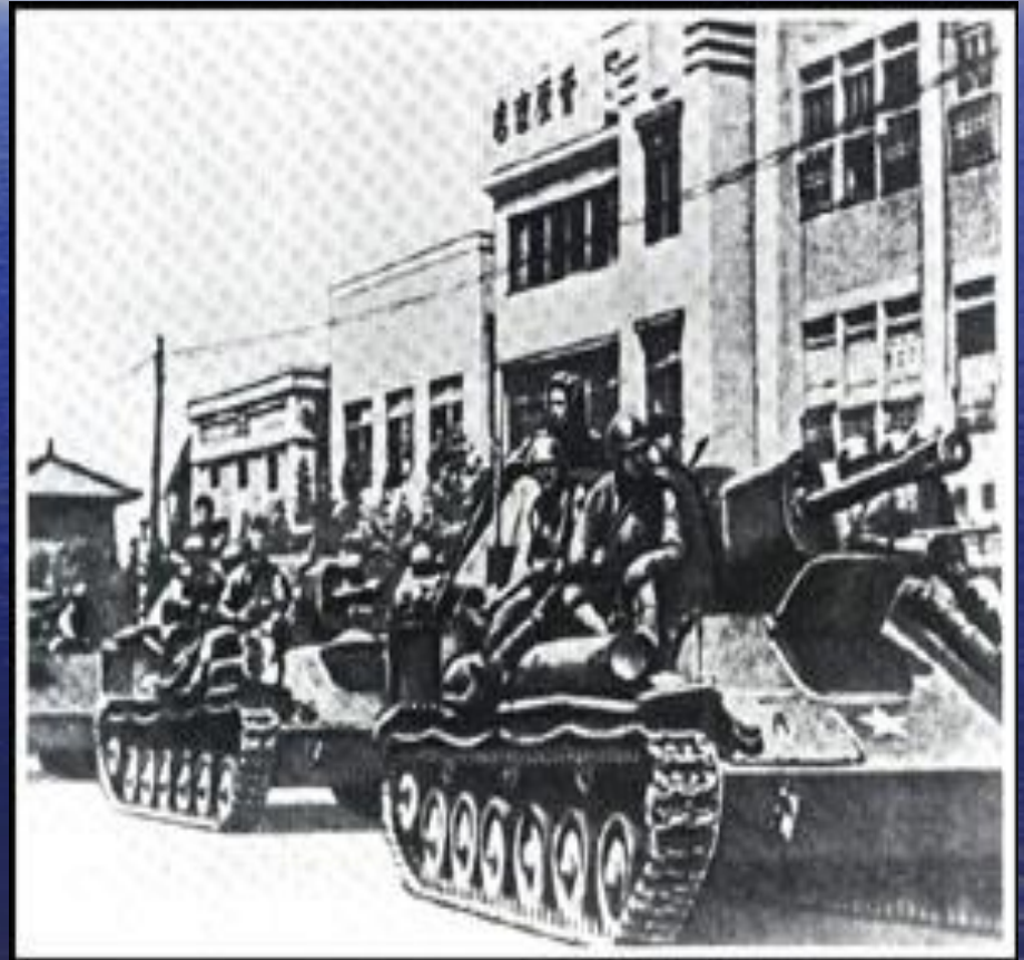
Советские войска входят в Чанчунь