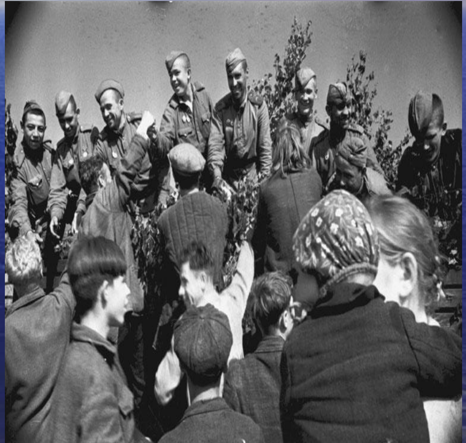
Латвийские граждане встречают освободителей 1944