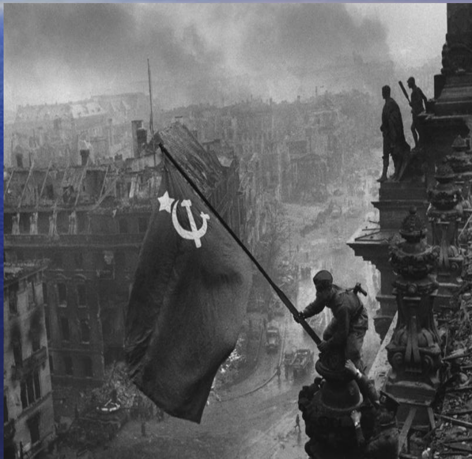
Воздвижение советского флага над рейхстагом