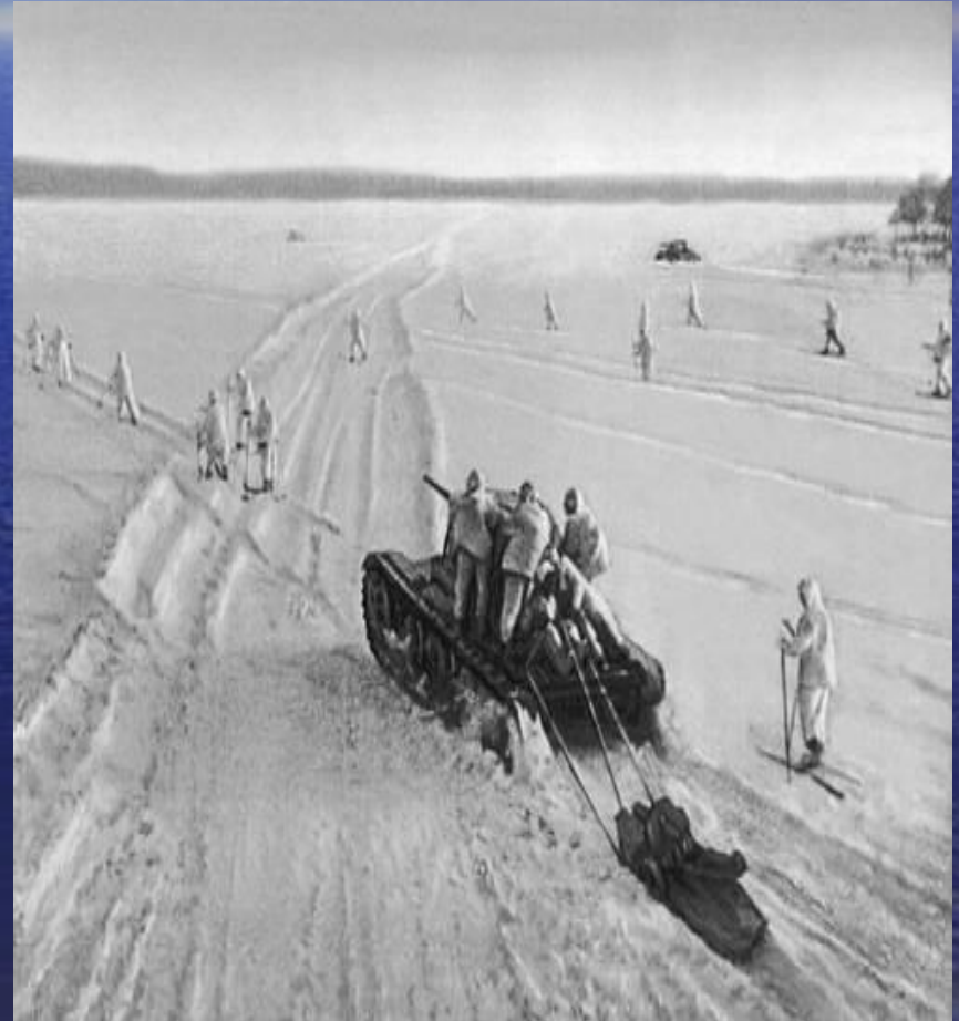
Русские солдаты в снегах подмосковья