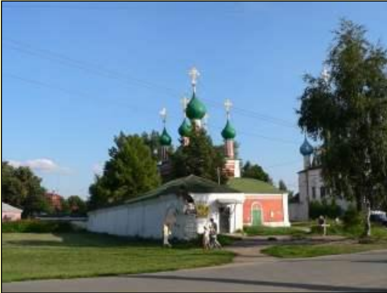
На Соборной площади Переславля-Залесского стоит церковь Александра Невского.

Александр Ярославич Невский родился 30 мая 1219 года в городе Переславле в княжьих теремах рядом со Спасо- Преображенским собором и прожил на свете сорок четыре года и пять с половиной месяцев.