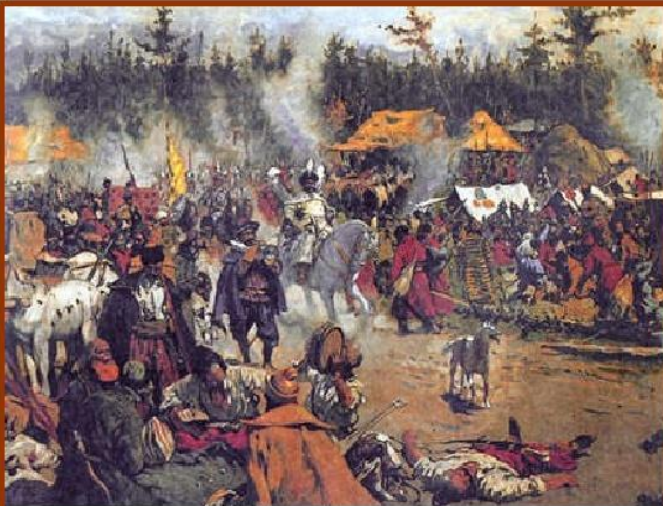
С.В. Иванов. "В смутное время"

И началось в Русском государстве страшное время, которое называли Смутой.