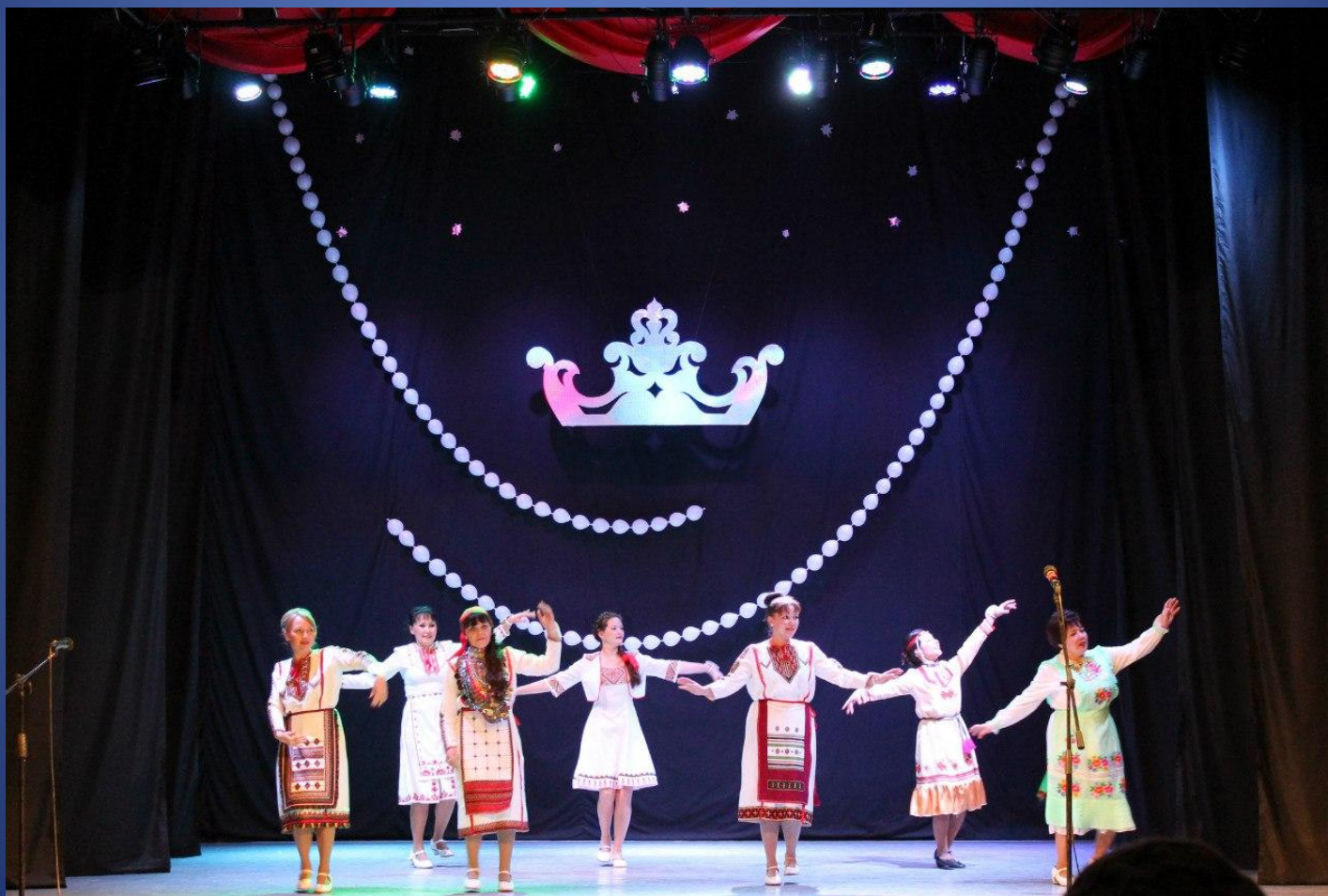
МБУК «Звениговский РЦДиК «Мечта»». Шоу-конкурс красоты и таланта «Мари Краса»

Создавая мероприятие, руководитель-режиссер, обладающий неординарным мышлением улавливает самые тонкие нюансы, сопоставляет несопоставимое, объединяет в общее, видит и чувствует то, чего лишены другие, тем самым создавая уникальный продукт.