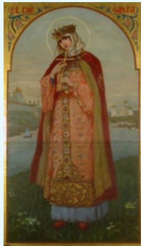
ОЛЬГА (945 - 969 г.г.)

В 968 г. руководила защитой Киева от печенегов.