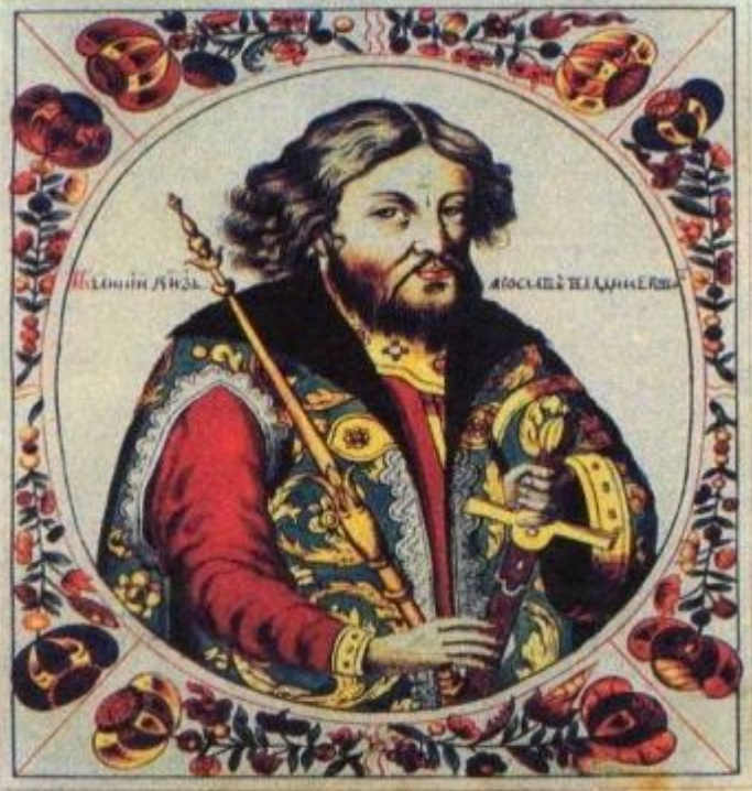
Великий князь Ярослав I Владимирович Мудрый.