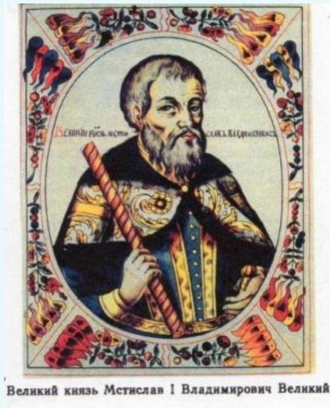
МСТИСЛАВ ВЕЛИКИЙ (1125 - 1132 г.г.)

Сын Владимира Мономаха. Князь новгородский (1088 - 1093 и 1095 - 1117 г.г.), ростовский и смоленский (1093 - 1095 г.г.), белгородский и соправитель Владимира Мономаха в Киеве (1117 - 1125 г.г.). С 1125 по 1132 г.г. - единовластный киевский правитель. Продолжил политику Владимира Мономаха и сумел сохранить единое Древнерусское государство. Присоединил к Киеву Полоцкое княжество в 1127 г. Организовал успешные походы против половцев, Литвы, черниговского князя Олега Святославовича. После его смерти почти все княжества выходят из повиновения Киеву. Наступает период феодальной раздробленности.