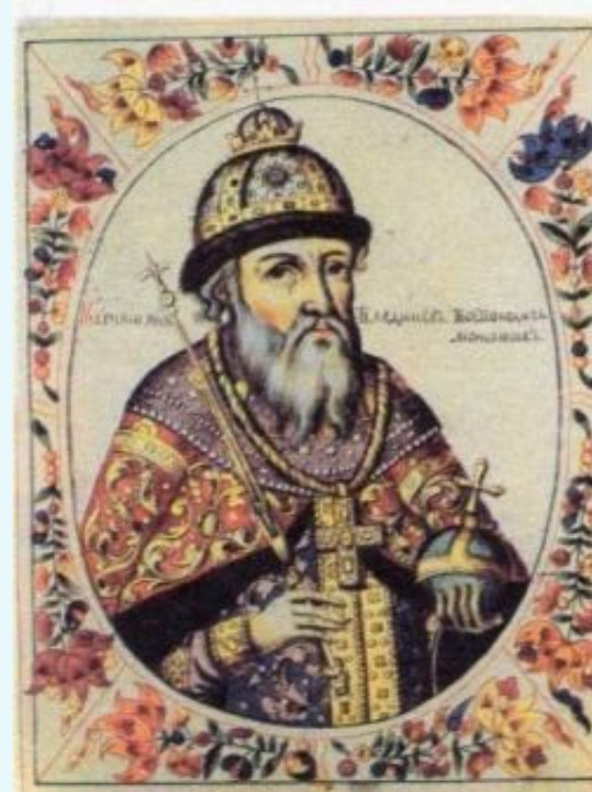
В Великий князь Владимир II Всеволодович Мономах.

Продолжил политику укрепления династических связей с Европой.