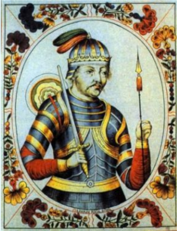
ИГОРЬ (912 - 945 г.г.)

Расширил границы Древнерусского государства, подчинив племя уличей и способствовав основанию русских поселений на Таманском полуострове. Отразил набеги кочевников-печенегов. Организовал военные походы против Византии: 1) 941 г. - закончился неудачей; 2) 944 г. - заключение взаимовыгодного договора. Убит древлянами при сборе дани в 945 г.