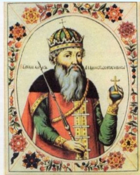
✓ Великий князь св. Владимир I Святославич.

988 г. - принятие христианства на Руси. При Владимире идет дальнейшее расширение и укрепление Древнерусского государства. Владимир окончательно покорил радимичей, совершил удачные походы против поляков, печенегов, основал новые крепости-города: Переяславль, Белгород и др.