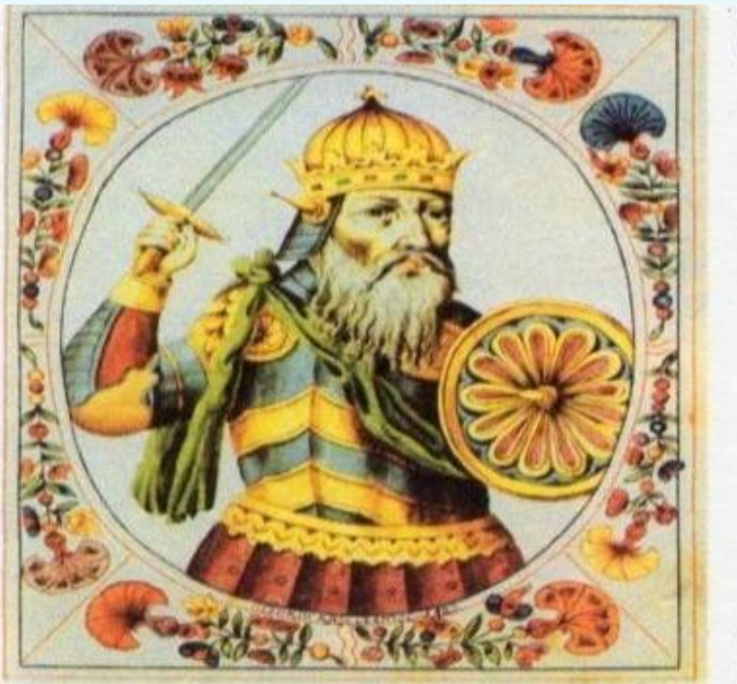
✓ Великий князь Святослав Игоревич.