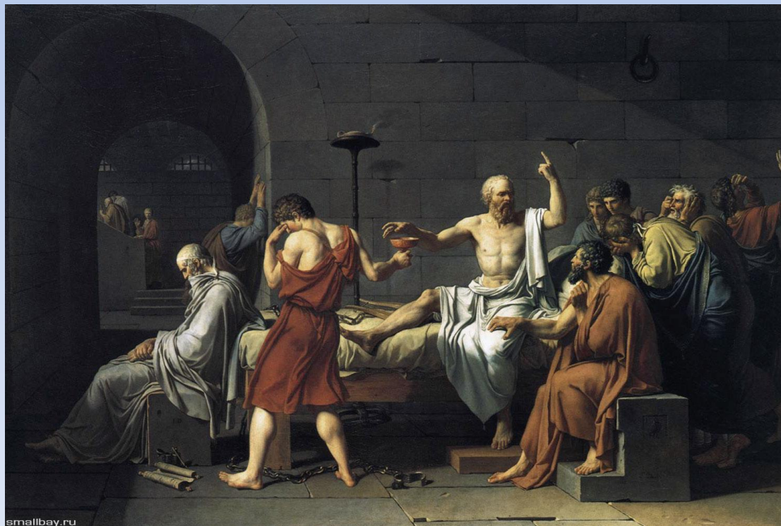
Давид Жак-Луи «Смерть Сократа»

В тетради: 5 имен философов – ГОДЫ ИХ ЖИЗНИ – ОСНОВНЫЕ