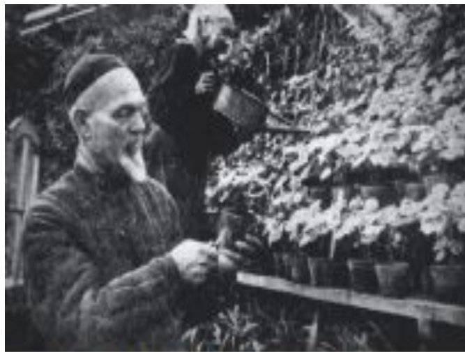
Ученый Н. И. Курнаков