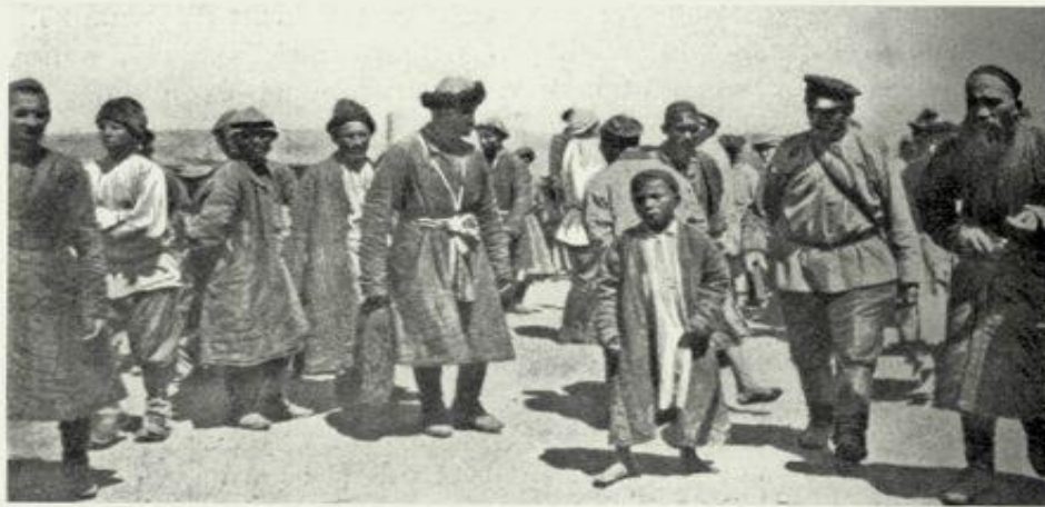
Қарқара жәрменкесі. Мына кітаптан: György Almasy. Vandorutom Azsia szivebe (Азия орталығына саяхат) . Budapest, 1903. Ярмарка Қарқара. Из кн.: György Almasy. Vandorutom Azsia szivebe (Путешествие в сердце Азии) . Budapest, 1903.