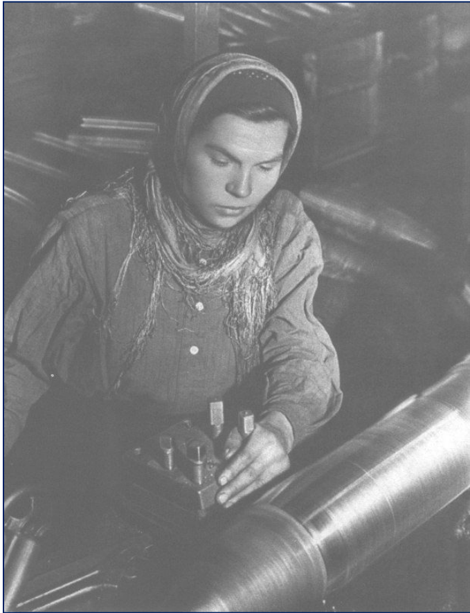
На Очёрском заводе (Молотовская область)

Вся материальная часть Уральского добровольческого танкового корпуса была создана уральскими рабочими во сверх плана и была оплачена за счет пожертвований населения. Из 8206 чел. личного состава корпуса только 536 чел. имели опыт военных действий.