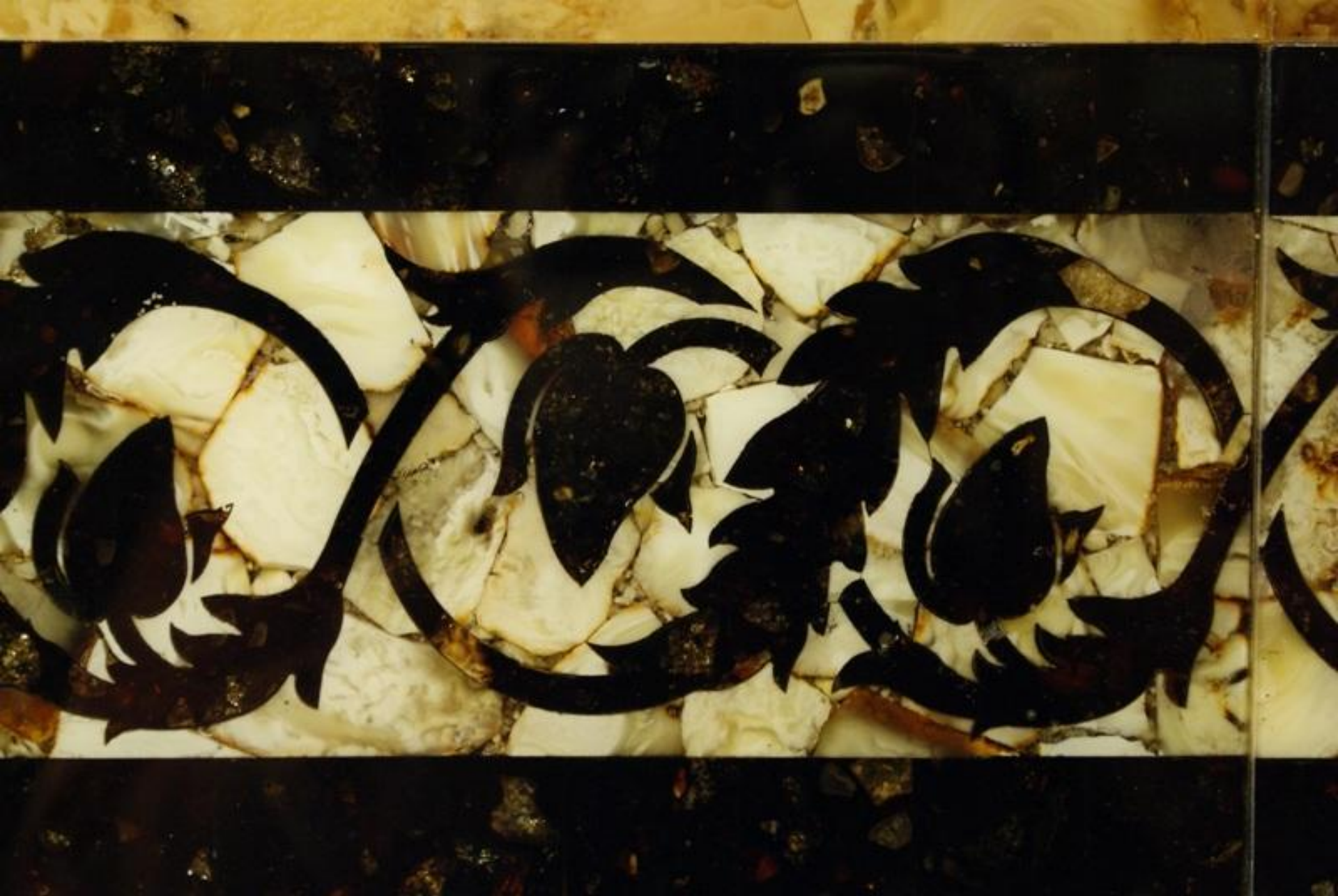
Фрагмент мозаики на стене