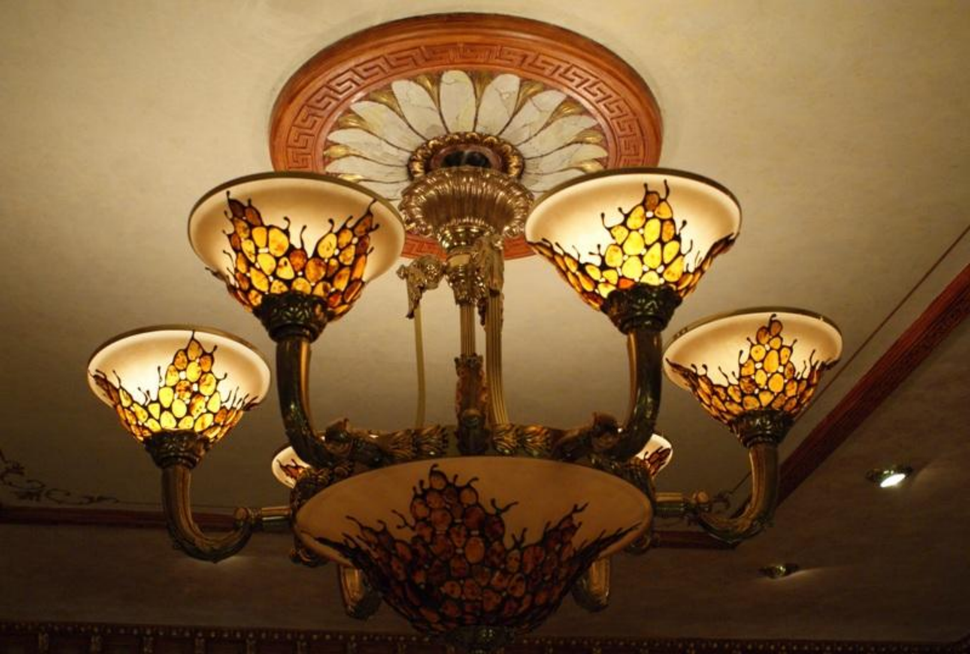
Люстра в янтарной комнате