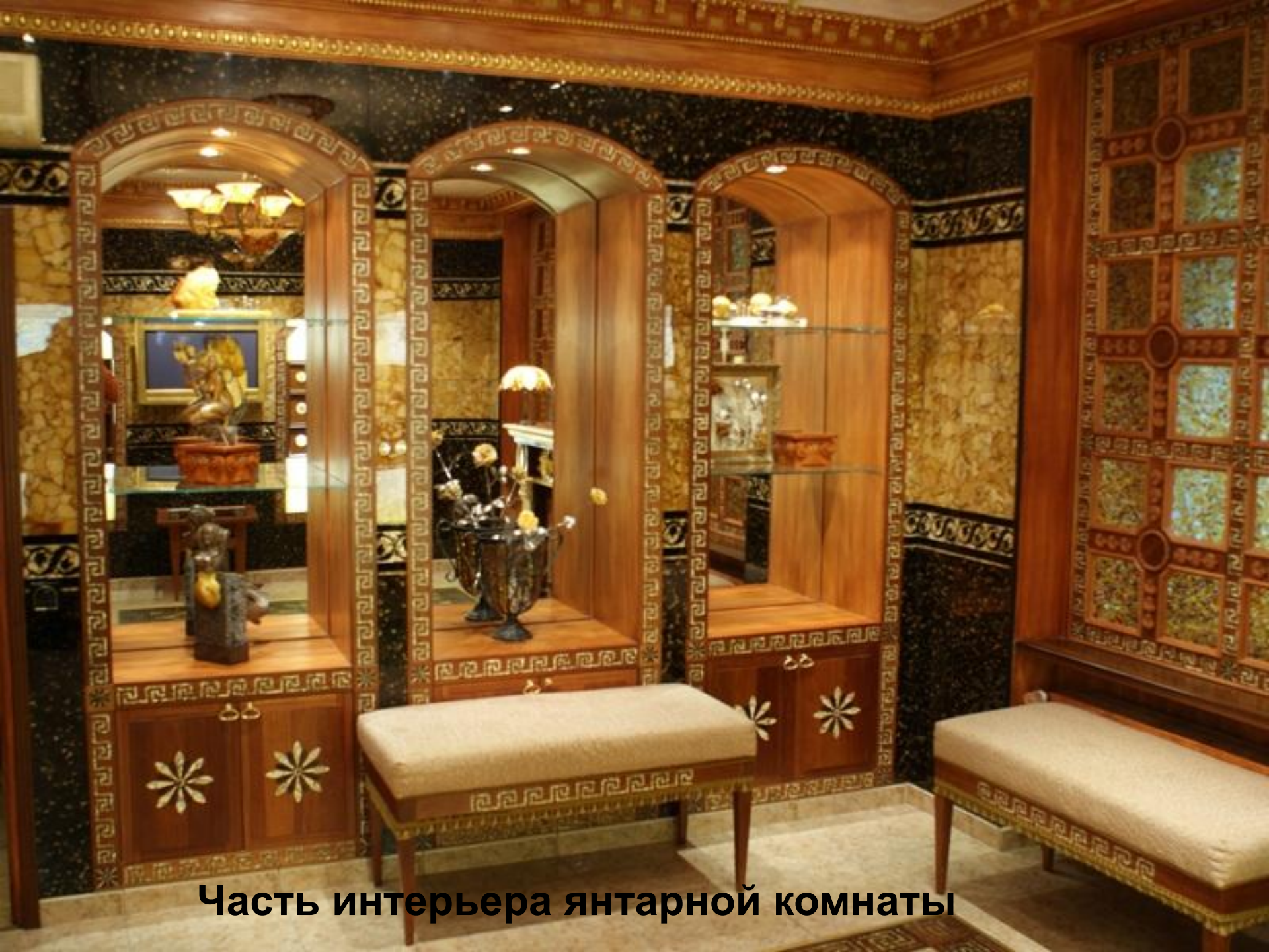
Часть интерьера янтарной комнаты