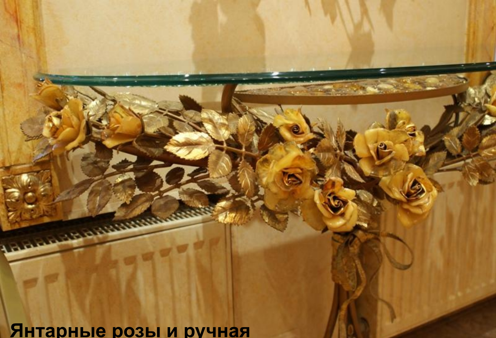
Янтарные розы и ручная кузнечная ковка