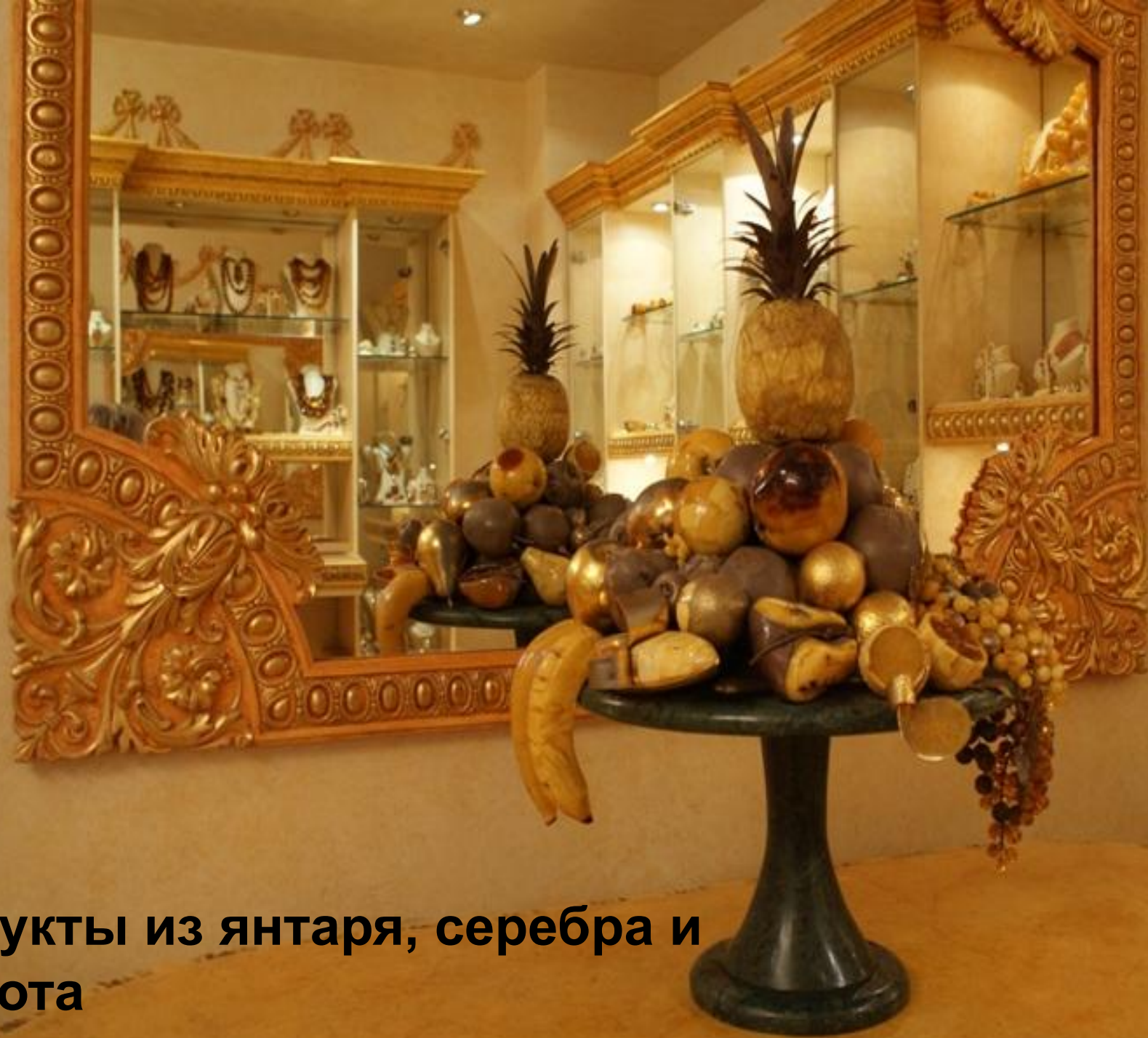
Фрукты из янтаря, серебра и золота