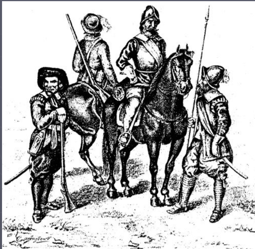
Шведские воины эпохи Густава-Адольфа (слева направо): мушкетер, драгун, кирасир, пикинер