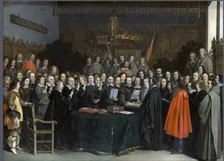
Подписание мира в Мюнстере