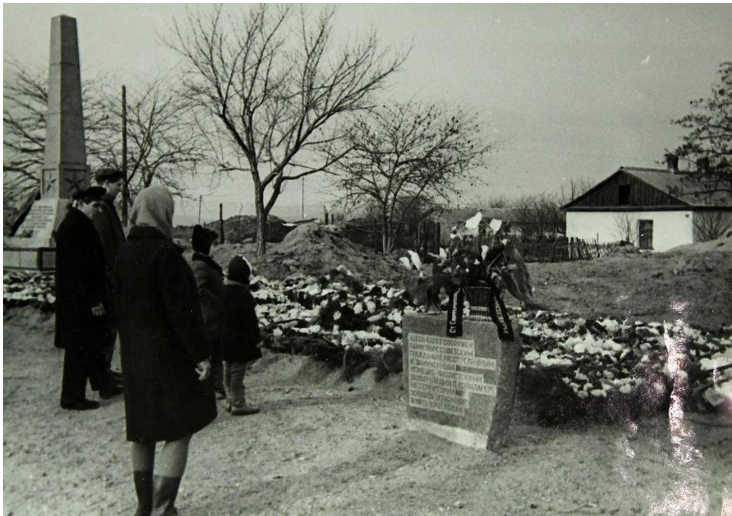
концлагерь «Красный» в 1944г