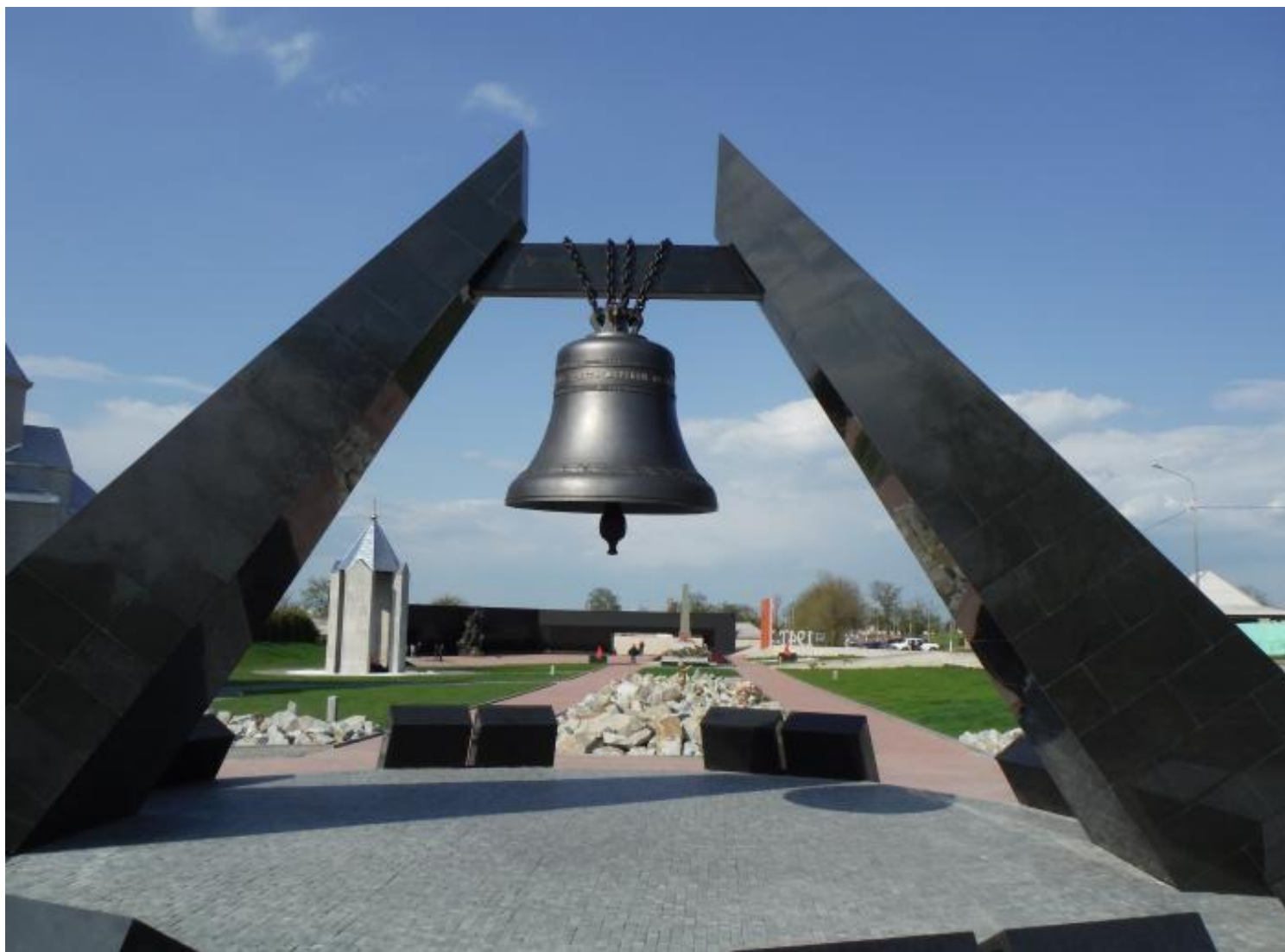
Ныне концлагерь «Красный»