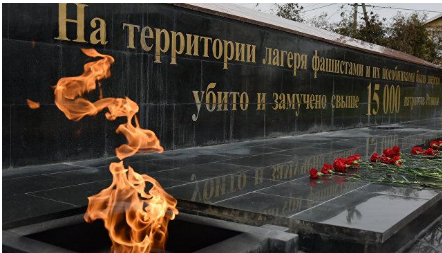
Мемориал концлагеря «Красный»