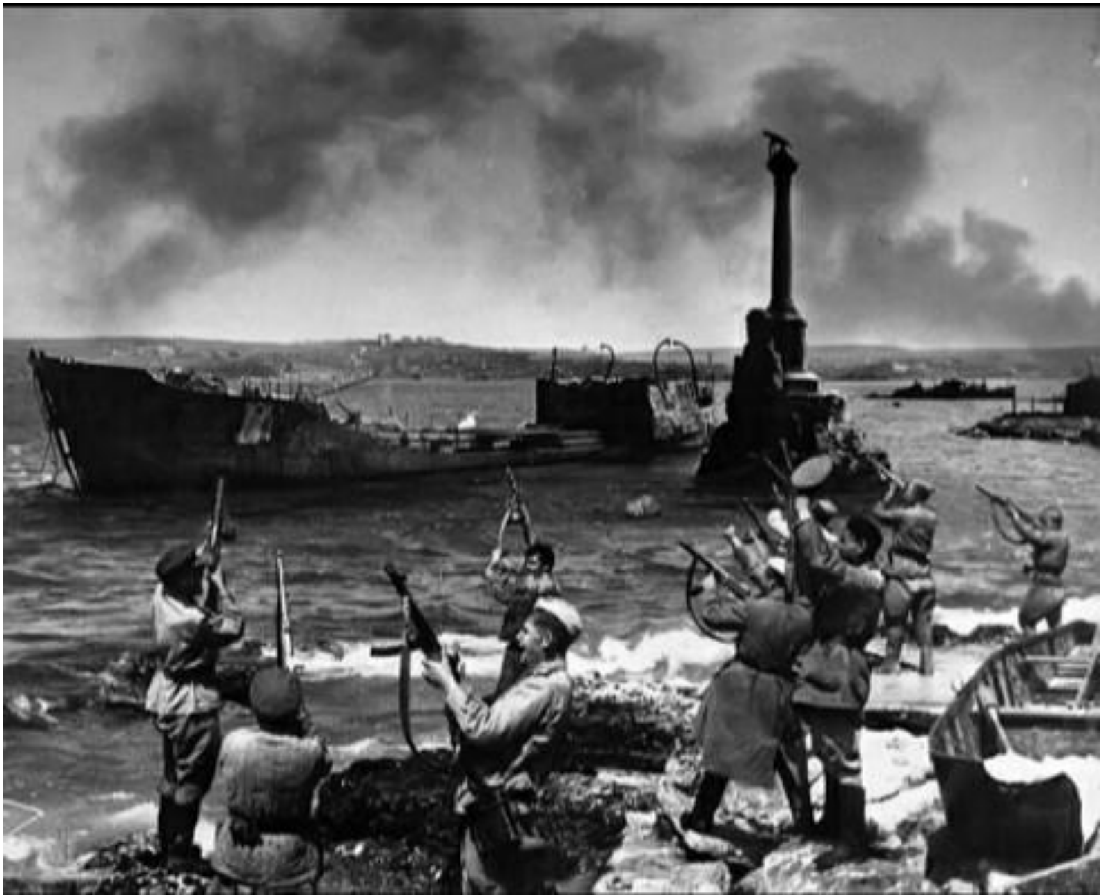
Освобождение Крыма 08.04.1941-12.05.1944