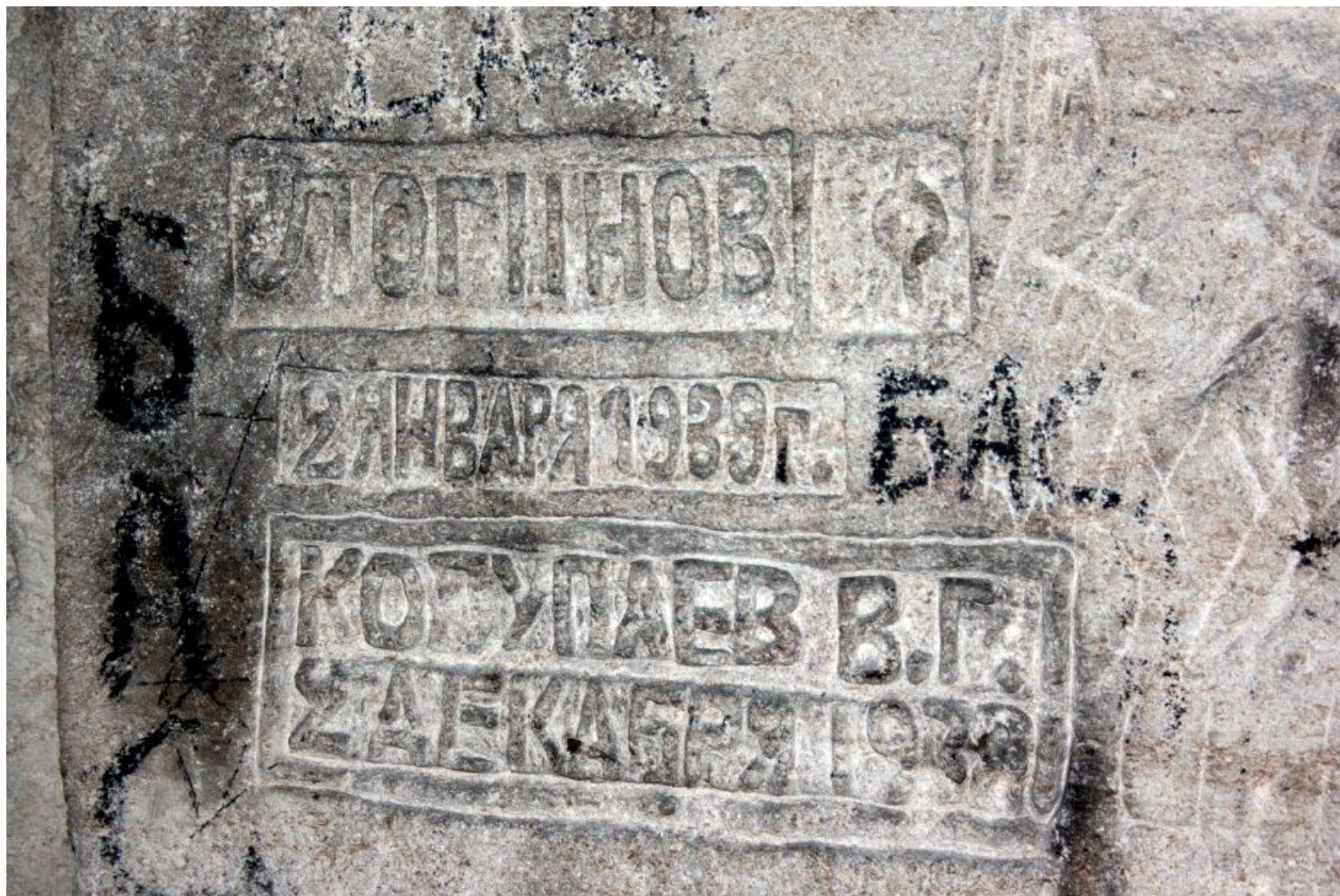
Одна из надписей в Каменоломне Старого Карантина