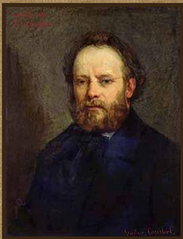
Пьер Прудон Бакунин