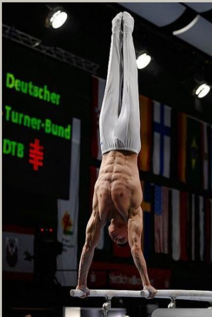
Гимнаст на параллельных брусьях

Гимнастика является технической основой многих видов спорта, соответствующие упражнения включаются в программу подготовки представителей самых разных спортивных дисциплин. Гимнастика не только дает определенные технические навыки, но и вырабатывает силу, гибкость, выносливость, чувство равновесия, координацию движений.