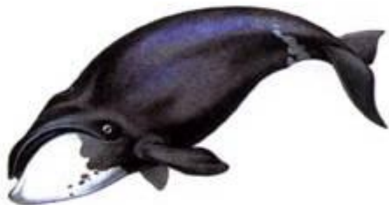
Гренландский (полярный) кит