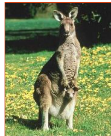
большой серый кенгуру