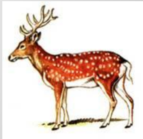
Уссурийский пятнистый олень