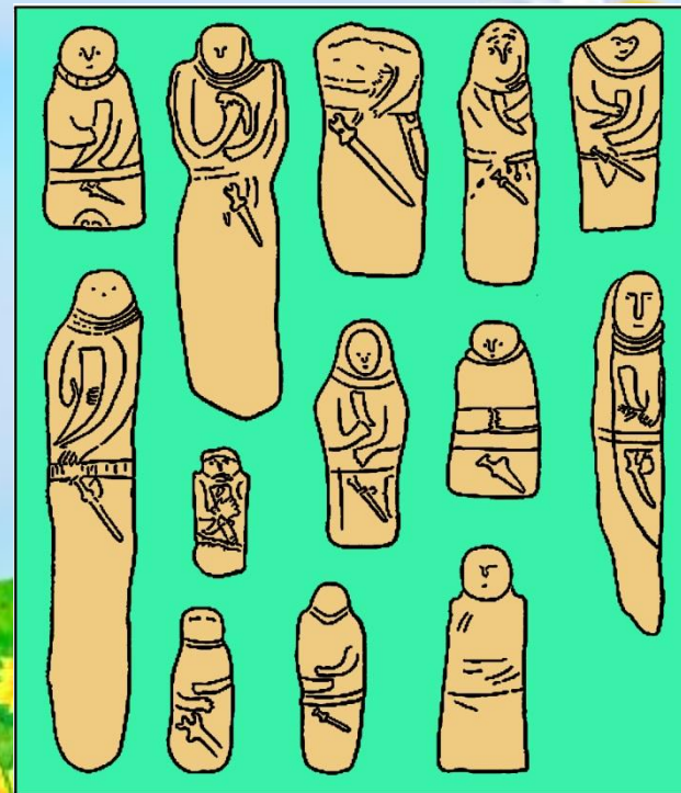
Скифские каменные бабы