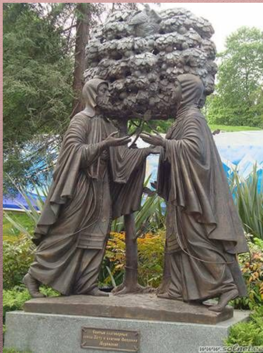
Памятник в Сочи