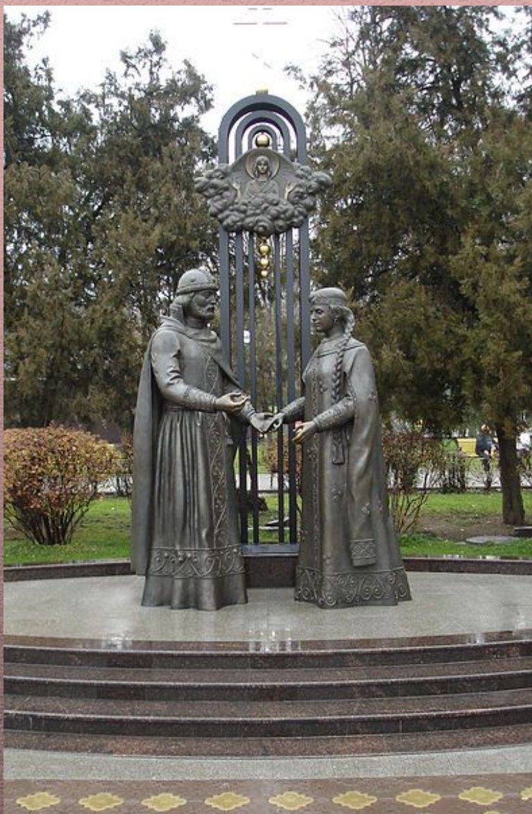
Памятник в Ростове-на-Дону