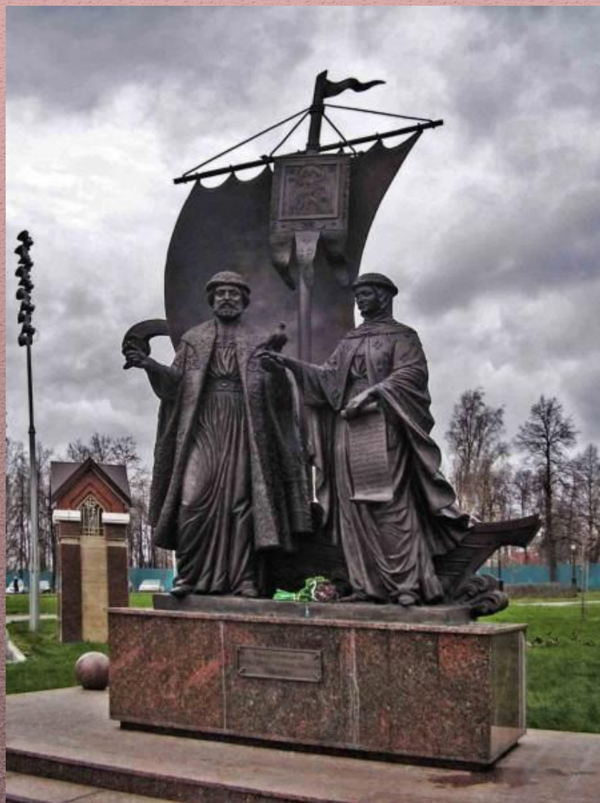
Памятник в Ижевске