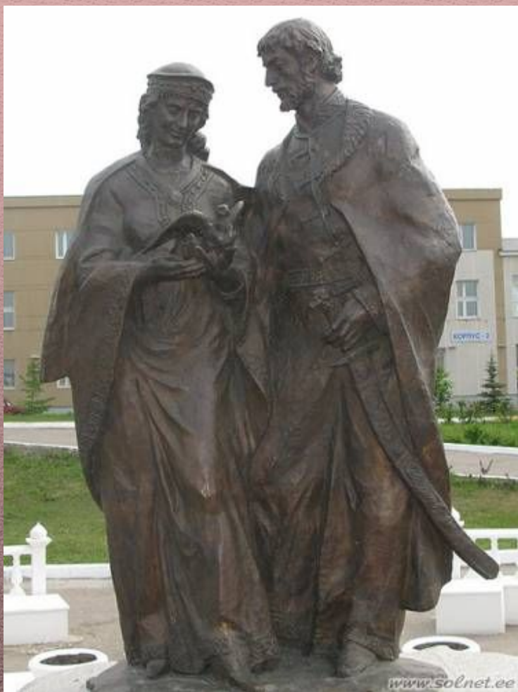
Памятник в Ульяновске