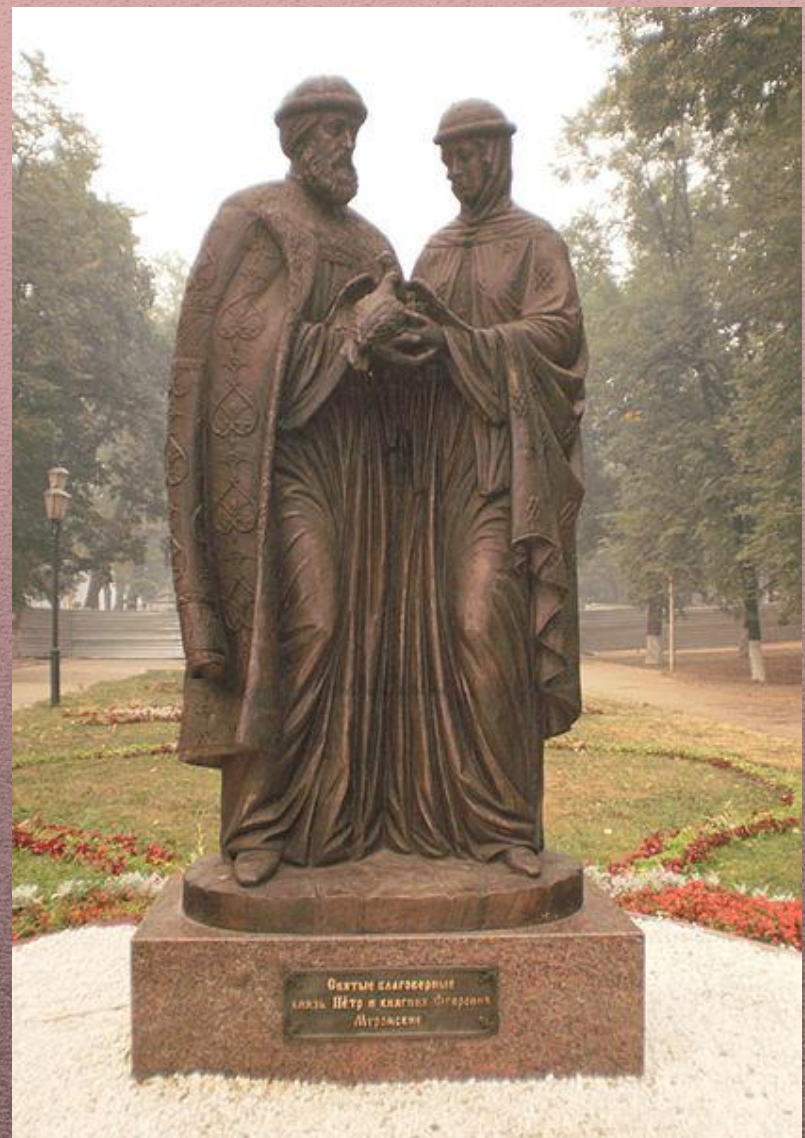
Памятник в Ярославле