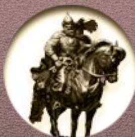
Киностудия «Илья Муромец»