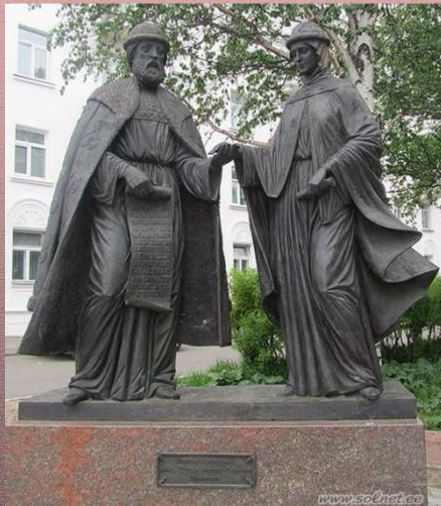
Памятник в Архангельске