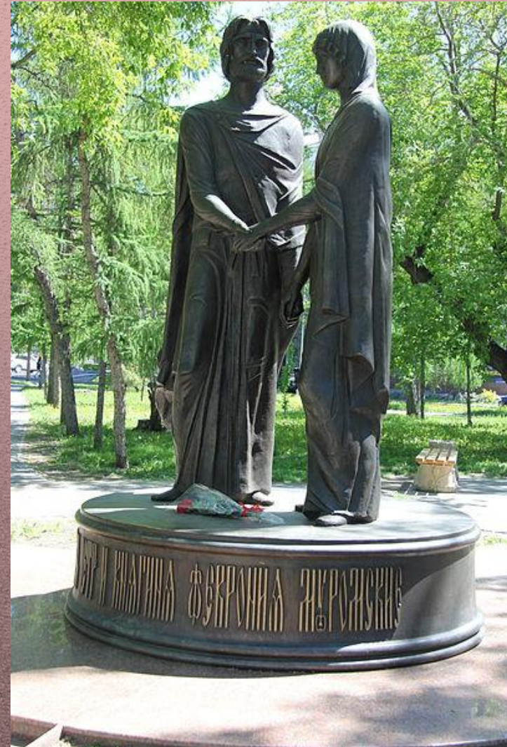
Памятник в Омске