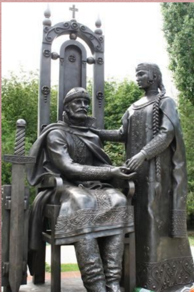
Памятник в Ейске