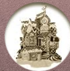
Парк «В кругу семьи»