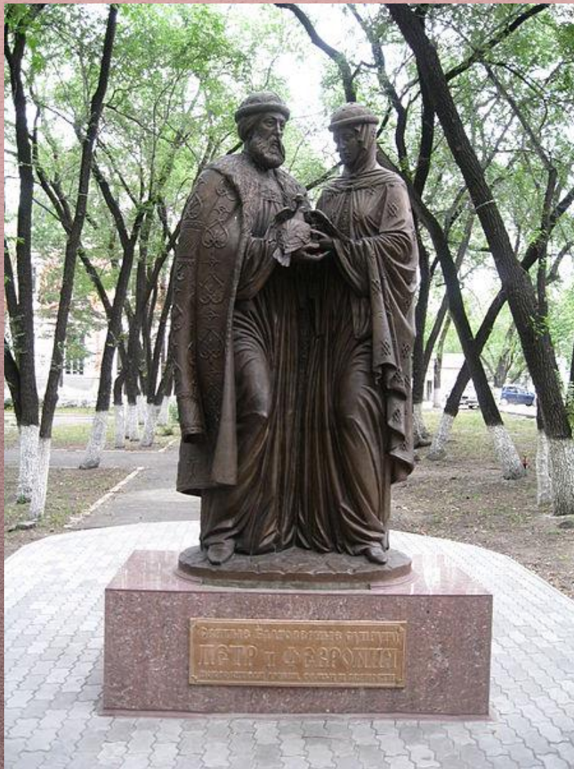
Памятник в Благовещенске