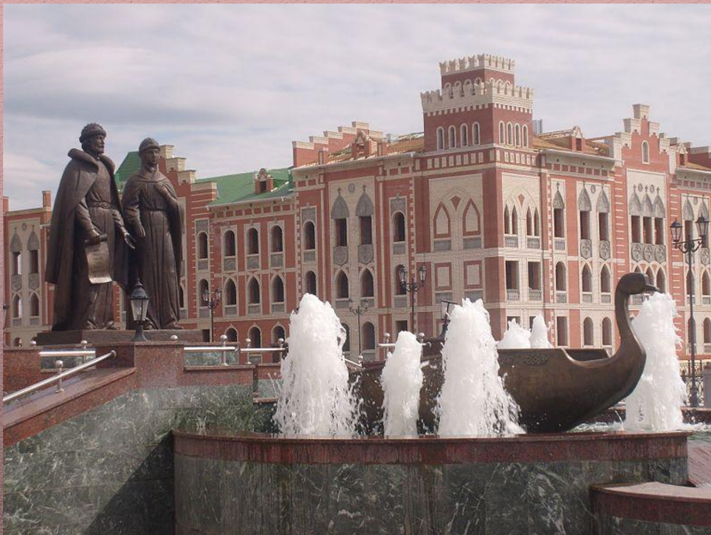
Памятник в Йошкар-Оле