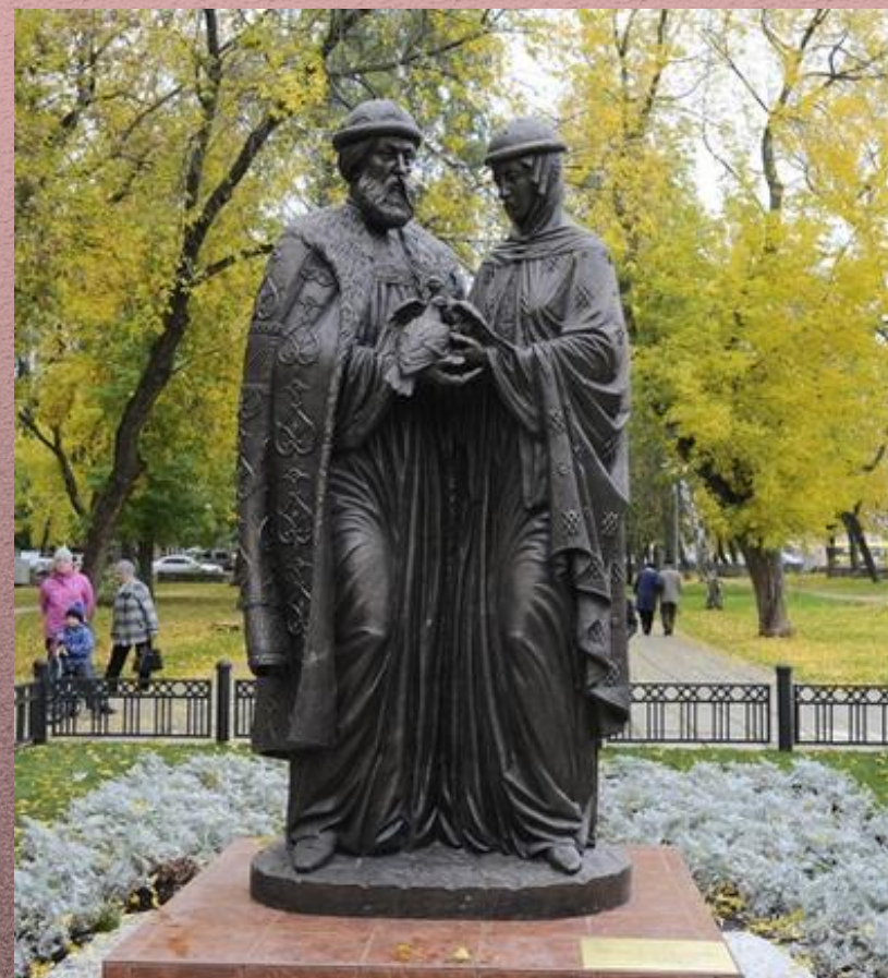
Памятник в Перми