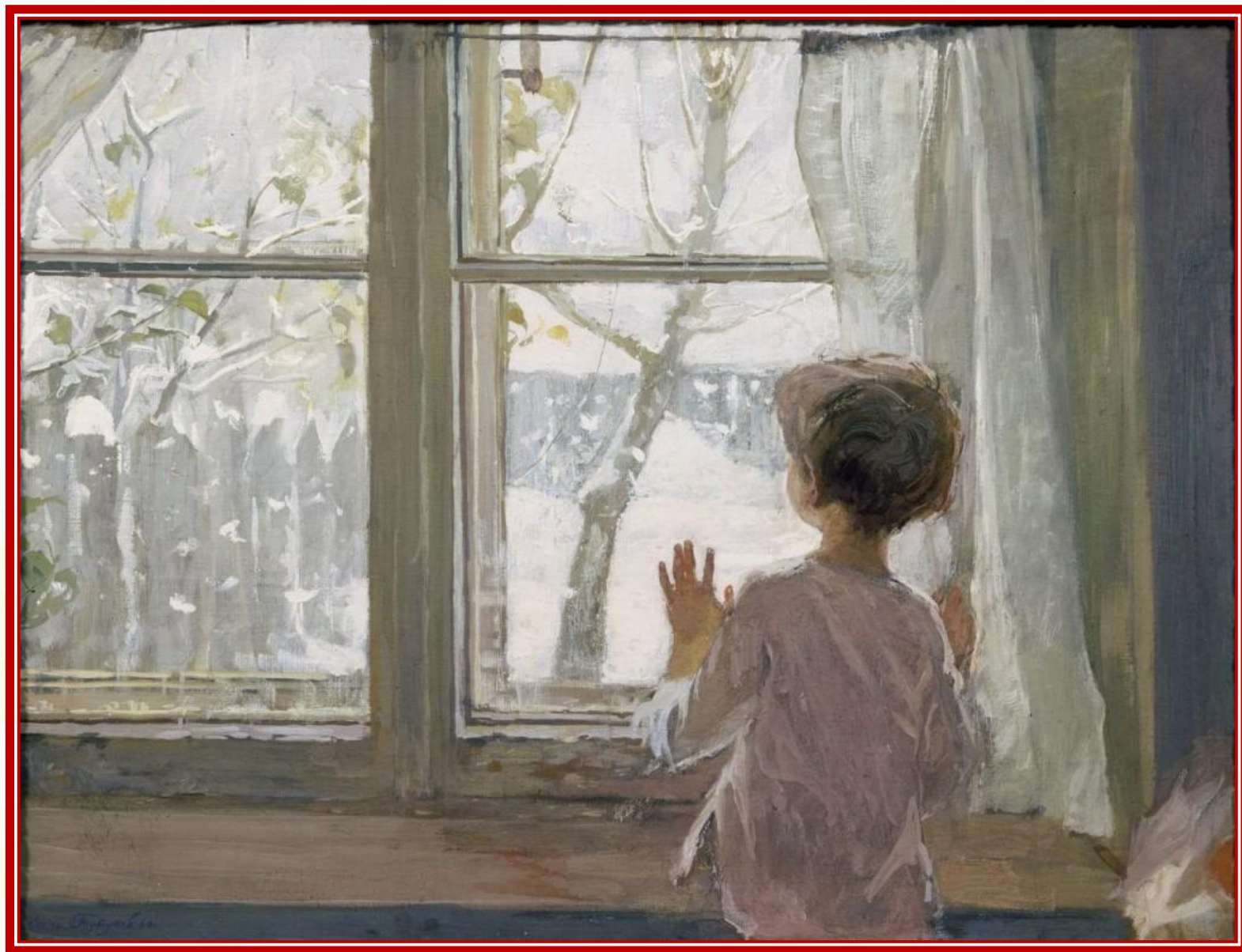
С.А. Тутунов «Зима пришла. Детство»