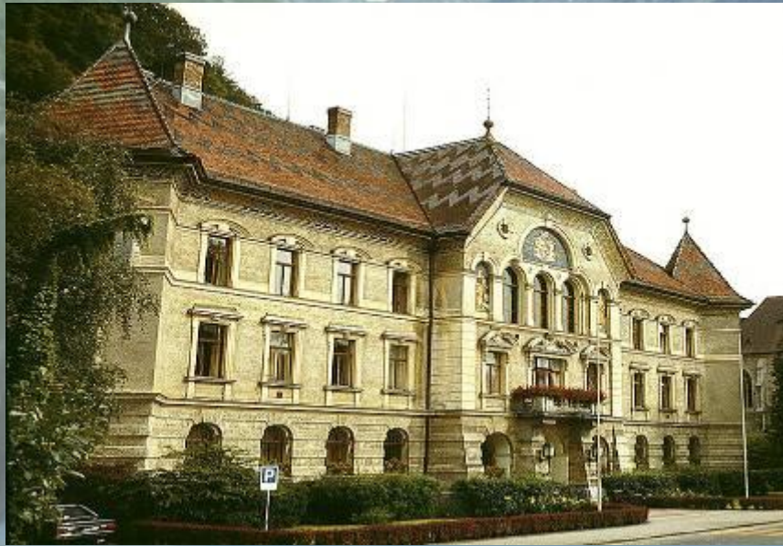
Здание правительства и парламента.

Лихтенштейн — конституционная монархия. Действующая конституция вступила в силу 5 октября 1921 года. Глава государства — Ханс-Адам II, князь фон унд цу Лихтенштейн, герцог Троппау и Егерндорф, граф Ритберг.