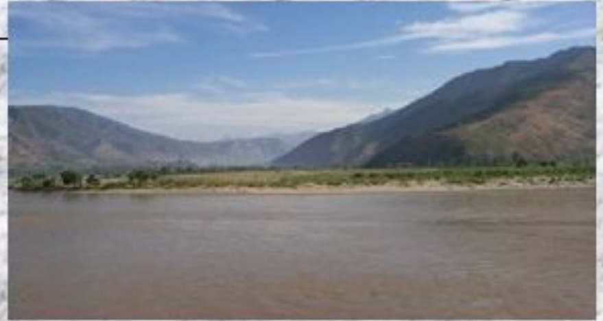
Р. Хуанхэ (желтая)