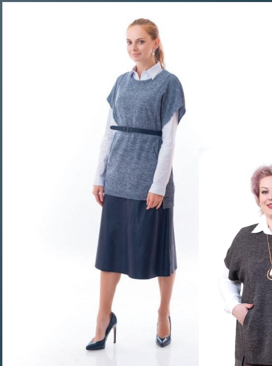
меланж светло -синий