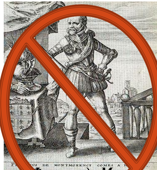
Филипп де Монморанси, граф Горн