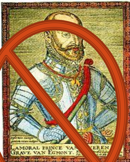
Ламораль, 4-й граф Эгмонт