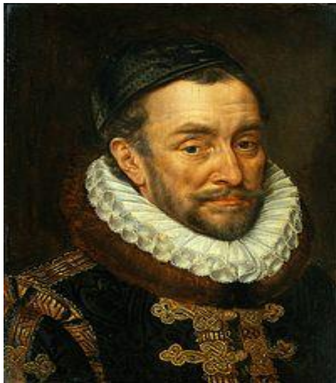
Вильгельм I Оранский