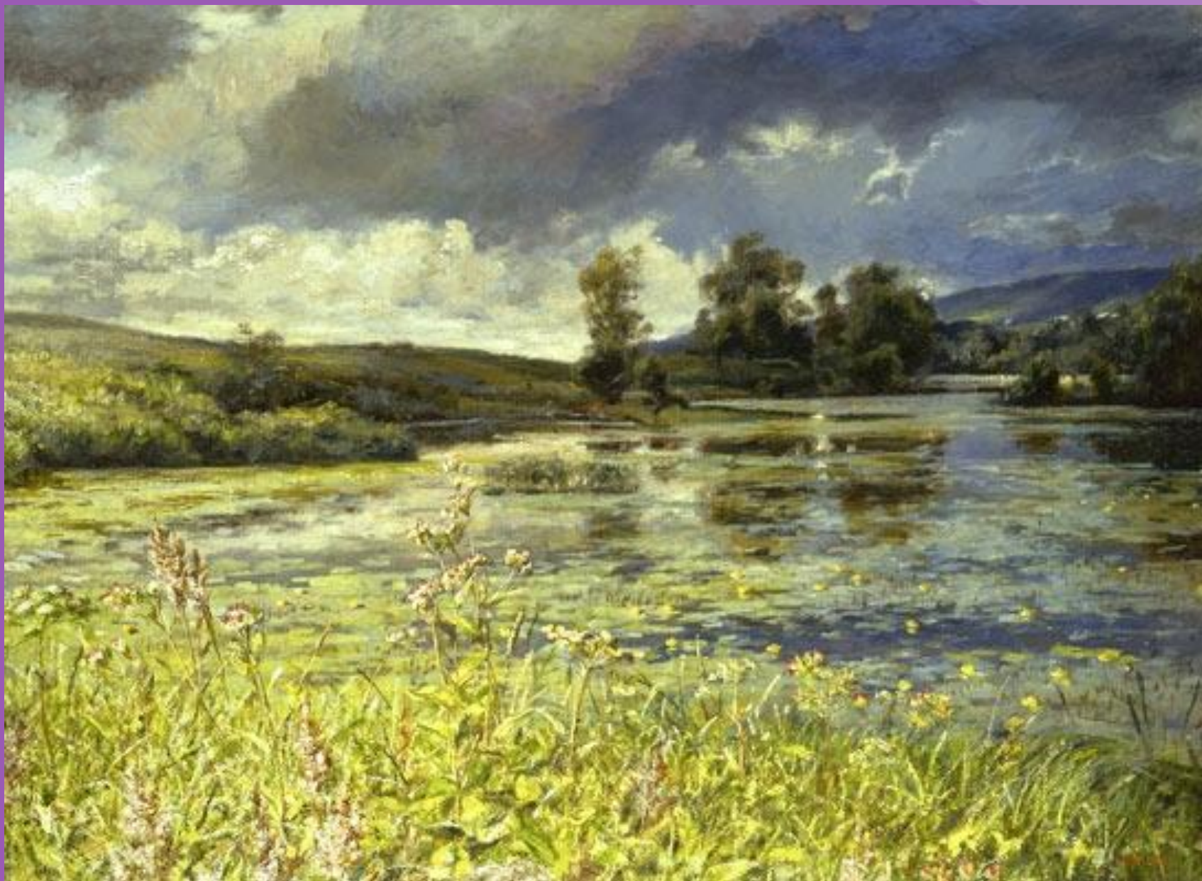
Прислониха – родина художника в Ульяновской области