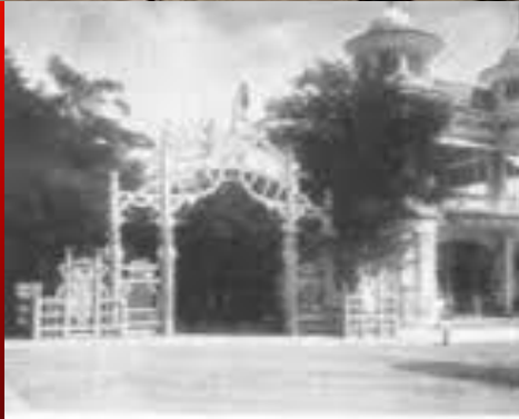
Главный ход в Николаевский цветник