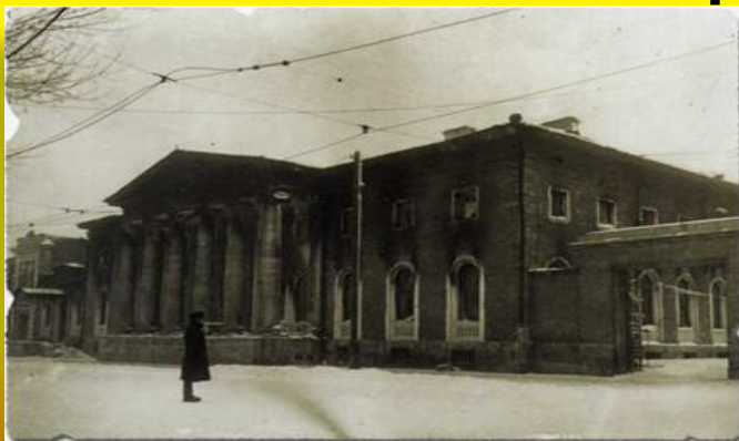
1943 год. Здание Бальнеологического института после фашистской оккупации