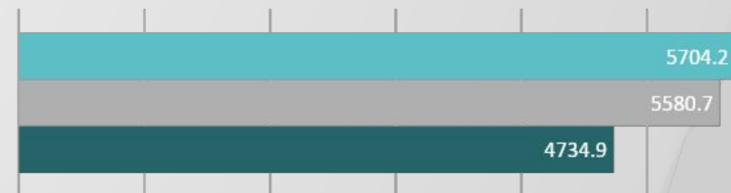
Объем платных услуг предприятий, оказывающих бытовые услуги населению, млн. руб