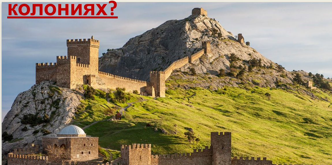
Генуэзская крепость в Судак

Как была налажена торговля в городах-колониях?