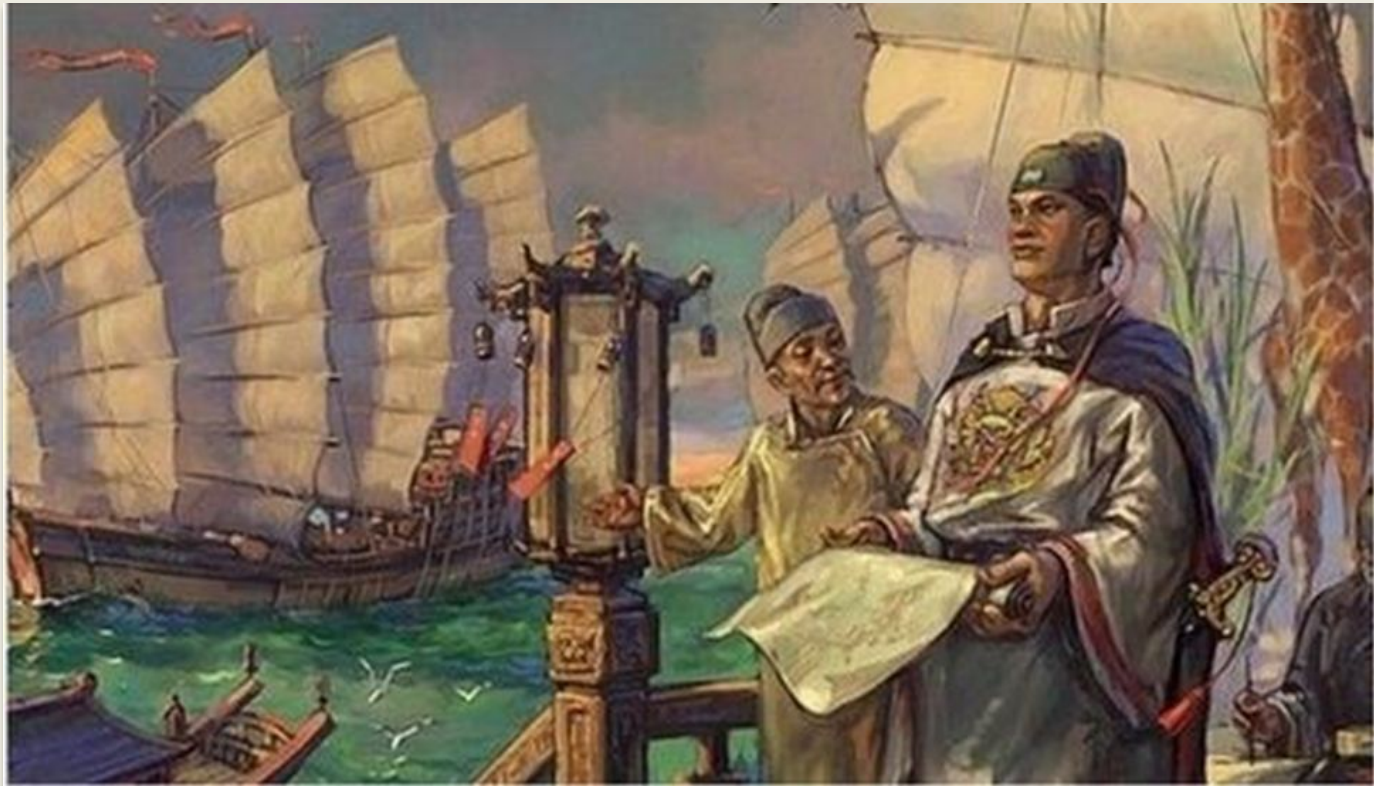
Китайский мореплаватель Чжэн Хэ

Какие перемены происходили в Восточной Европе в начале XV в. ?