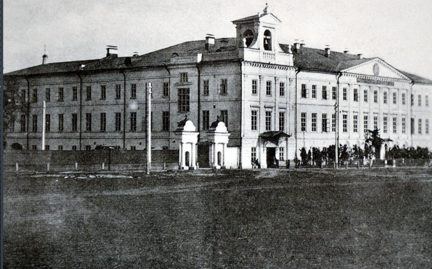
Вятка.—Viatka. № 2. Духовное училище.—Ecole ecclésiastique.

Вятская духовная семинария была создана в 1758 году на базе славяно-латинской школы. В её учебную программу кроме гуманитарных наук, латинского и греческого языков и богословских знаний вошли гражданская история, география, алгебра, геометрия, немецкий и французский языки, архитектура и другие светские учебные дисциплины. Первоначально она размещалась в кельях Успенского Трифонова монастыря, которые по мере развития семинарии становились для неё всё более тесными. Преемник Варфоломея Любарского епископ Лаврентий II Баранович распорядился о построении для семинарии специальных зданий и определил место строительства - за городом, за речкой Люльченкой, на территории Филимоновской архиерейской дачи. В 1795 году, на период переезда на новое место, в семинарии обучалось свыше 700 человек. Ансамбль Вятской духовной семинарии на землях загородной Филимоновской дачи складывался в конце XVIII - начале XIX веков.