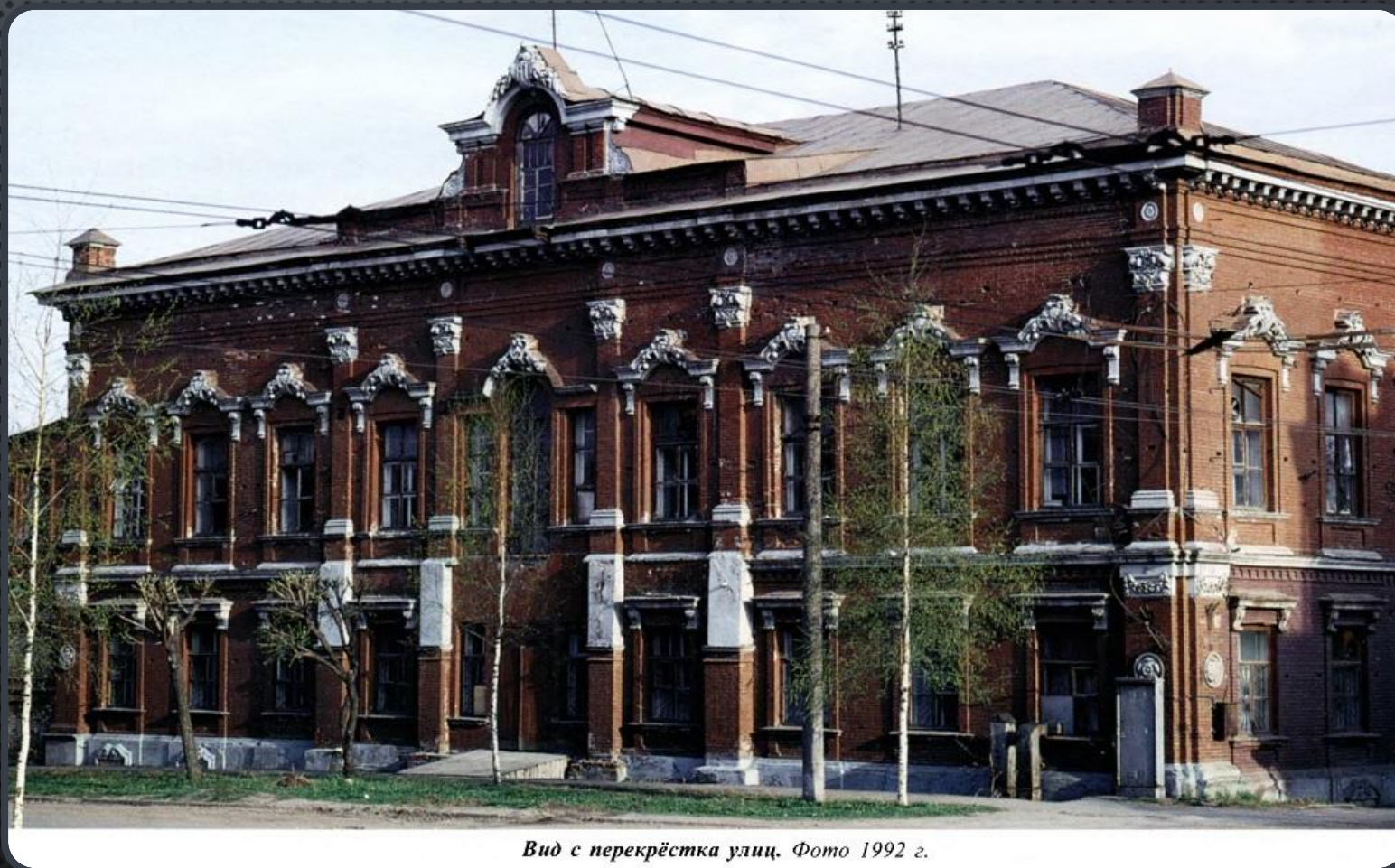
Вид с перекрёстка улиц. Фото 1992 г.