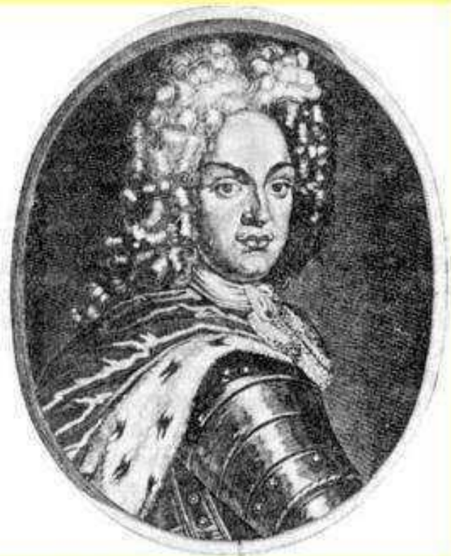
Август II Сильный, курфюрст Саксонии и король Польши

В ходе переговоров Петр I и Август II пришли к выводу о том, что они оба заинтересованы в борьбе с общим врагом.