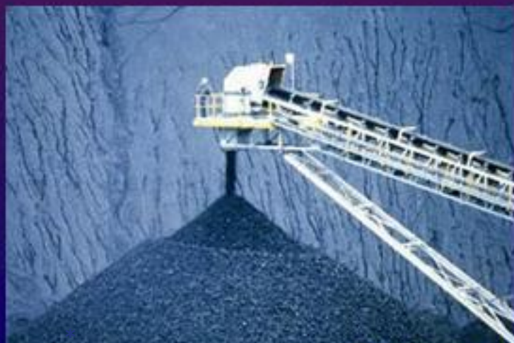
Добыча каменного угля