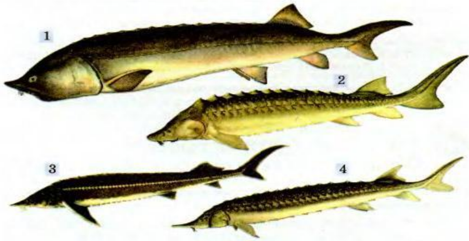
: 1 — белуга; 2 — осетр азово-черноморский; 3 — стерлядь; 4 — севрюга