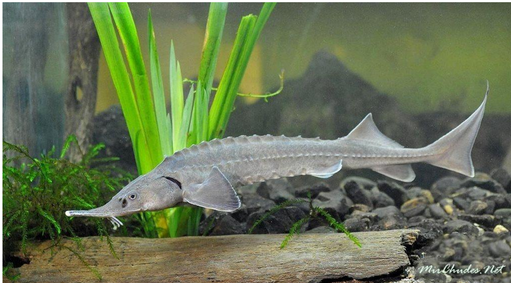
Сибирский осетр Acipenser baerii