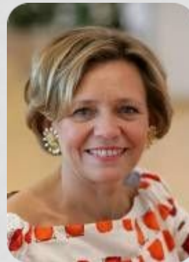
Irini Pari Grecja Grupa Pracodawców (Gr. I)