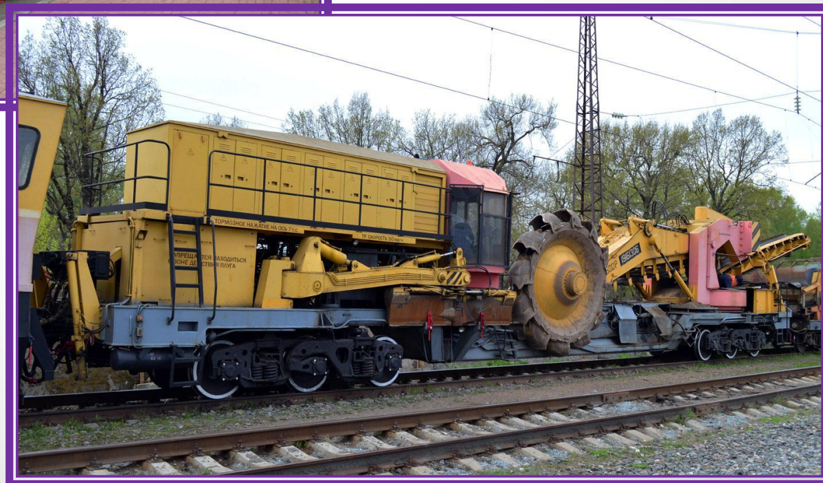
КЮВЕТО- ОЧИСТИТЕЛЬНАЯ МАШИНА