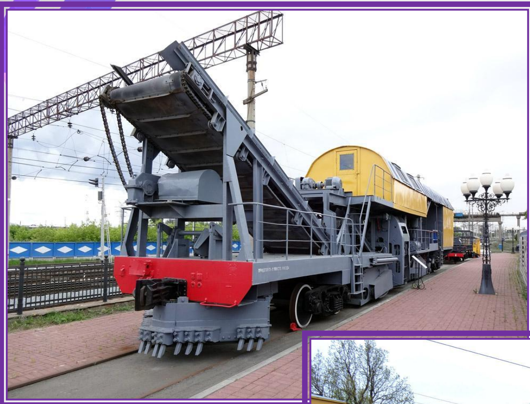
ПУТЕВАЯ ЗЕМЛЕУБОРОЧНАЯ МАШИНА