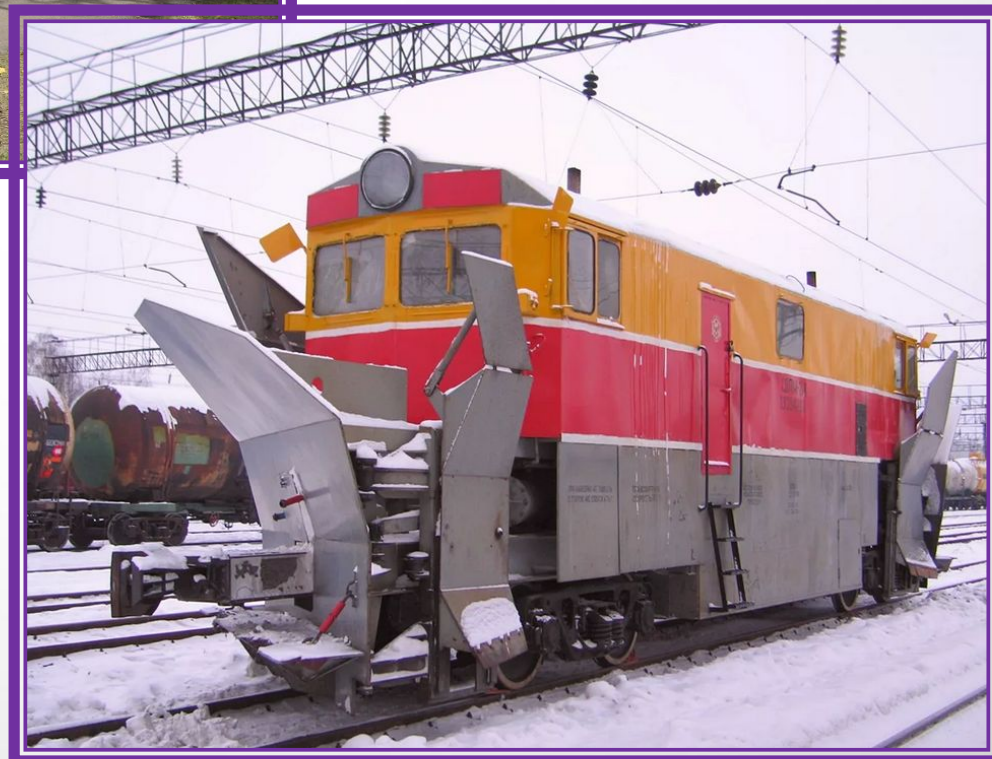
ПУТЕВАЯ СНЕГОУБОРОЧНАЯ МАШИНА