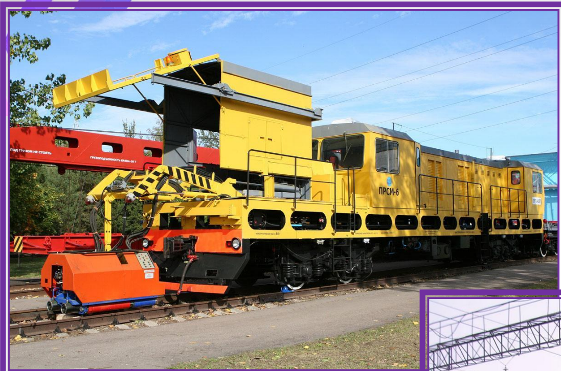
ПУТЕВАЯ РЕЛЬСОСВАРОЧНАЯ САМОХОДНАЯ МАШИНА