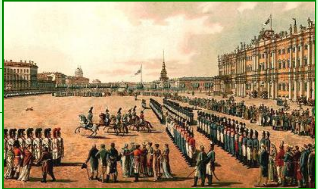
Александр I на смотре войск

Хотя Общества были тайными, информация о них доходила до Александра I. Члены южного общества И. В. Шервуд и А. И. Майборода написали доносы, но император долгое время никого не арестовывал, а начал преследование тайных обществ.