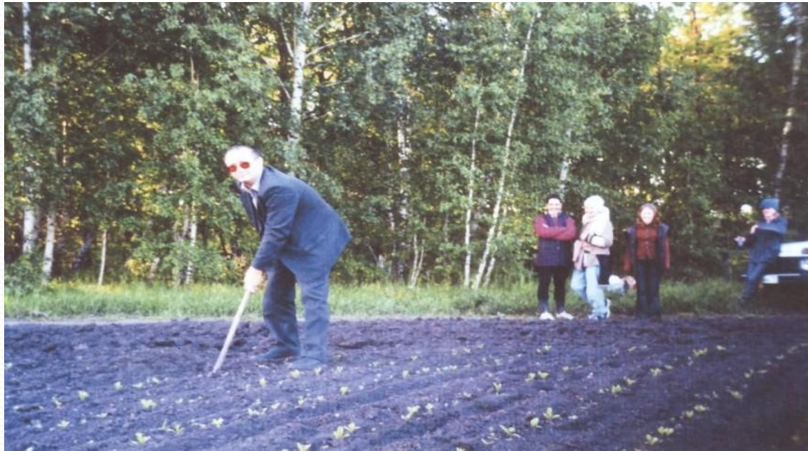
И.И. Трушкин. Свекольное поле