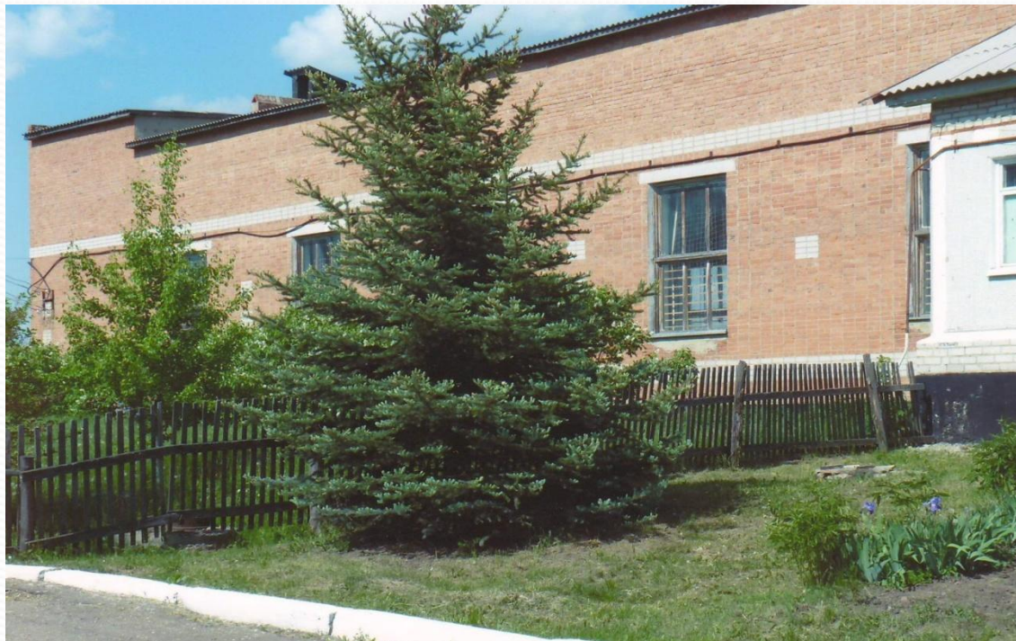
Школьный спортзал – самый большой в области