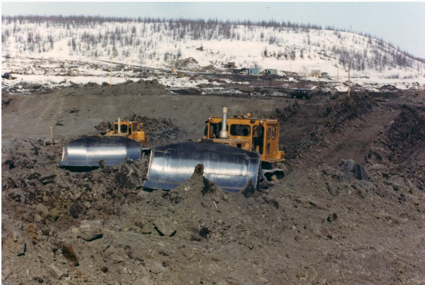
Работа на приискаx в Магадане