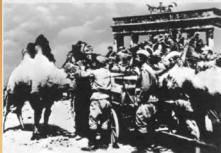
Верблюд Яшка в Берлине