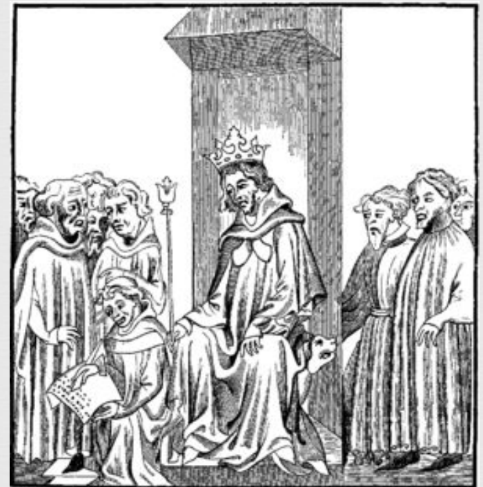
Король франков дарует народу Салический закон. Французская миниатюра XIV в.