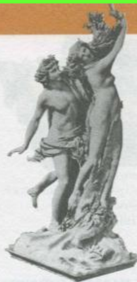
Лоренцо Бернини. Аполлон и Дафна. 1622—1625 г.

Испытав мощное воздействие предшествующей эпохи Возрождения, искусство XVII в. переживало бурный расцвет. Рубенс и Рембрандт, Веласкес и Караваджо, Пуссен и Вермер — эти гениальные мастера представляли школы живописи в разных странах. Но героические идеалы Возрождения в XVII в. несколько померкли. Мастера искусства стали показывать трагичность жизни, крушение надежд, страдания и гибель героев. Два стиля — барокко и классицизм — господствуют в искусстве XVII в. Стиль барокко зародился в Италии. Итальянское слово «барокко» означает «причудливый», «странный». Художники, работавшие в стиле барокко, старались создать волшебную иллюзию, поразить ум и чувства зрителя пышностью и грандиозностью. Первые признаки классицизма проявились во второй половине XVI в. в Италии, но родиной классицизма по праву считают Францию. Главная черта классицизма — обращение к античному искусству, утверждение высоких гражданских и нравственных идеалов.